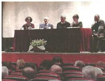
La serata per presentare l'arrivo dei profughi