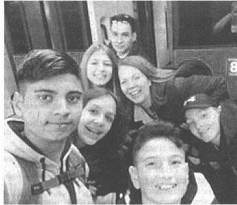
Il gruppo di studenti ha vinto la sfida nazionale di robotica creando Tino e Tina, con risvolti ecologici

fatto i salti mortali per poter conciliare gli impegni scolastici, quelli extracurricolari e sportivi. Ma nessuno si è mai lamentato. Ora si stanno preparando agli esami di terza media e a perfezionare il progetto per gareggiare al meglio in Australia». L'ostacolo è notevole, la spesa altissima: parte così una colletta per permettere al TecnoTeam di ritirare il suo premio, l'appello riguarda tutti, se tante persone si unissero, sarebbe un bel risultato. Chi volesse contribuire può scrivere a vaic81700p@istruzione.it , con oggetto: "contributo mondiali Sydney". La scuola risponderà mandando l'I-banper il versamento. In caso di mancato raggiungimento della cifra necessaria, le donazioni saranno restituite. «Questo risultato lusinghiero fa onore alla nostra scuola e alla città - spiegano in municipio - Impegno ed entusiasmo non possono andare delusi: la competenza dimostrata per creare i robot Tino e Tina è notevole».