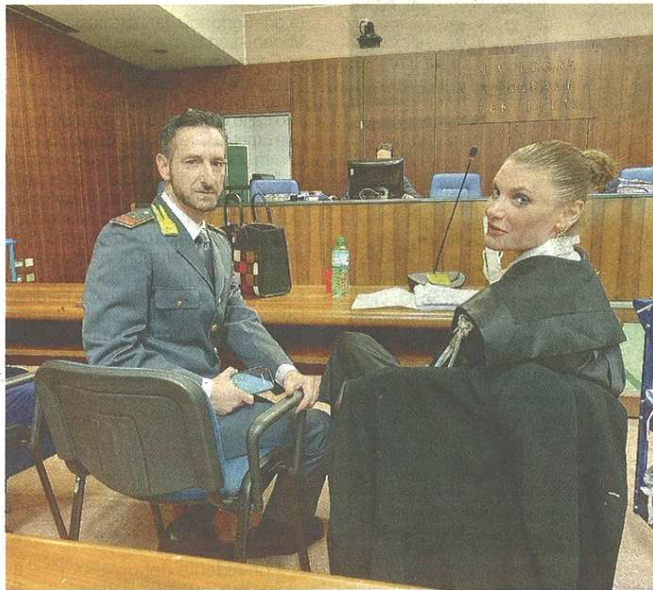
Il pm Nadia Calcaterra con il luogotenente della Gdf Giovanni Antico

Stando a quanto ricostruito attraverso una paziente attività di intercettazioni ambientali e telefoniche, gli inquirenti ritengono che i tre fossero specializzati nella vendita di "pacchetti elusivi". Ossia, avevano costituito imprese votate al nulla, senza neppure un prodotto o un servizio di facciata, nate solo per emettere fatture false a beneficio di aziende che volevano rispar-