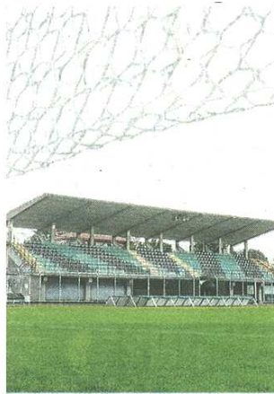
Lo stadio al centro del dibattito politico

Stefano Di Maria © RIPRODUZIONE RISERVATA