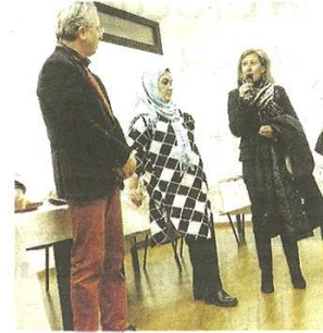
La festa delle donne arabe con il sindaco