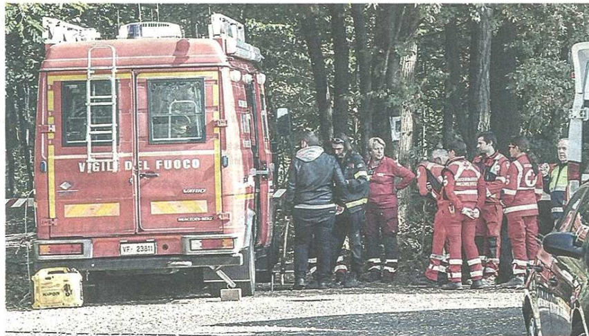
SOS Le ricerche della ventenne scomparsa e poi fortunatamente ritrovata sana e salva nei boschi dello spaccio