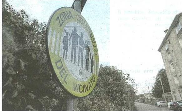
I cartelli in via Venezia segnalano che il servizio è già attivo (blitz)

publicato il 14/11/2017 a pag. 30; autore: Stefano Di Maria