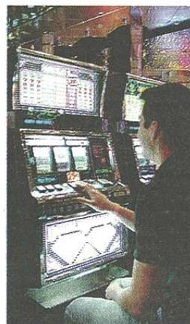
Il Comune premia i bar che hanno deciso di rinunciare all'azzardo