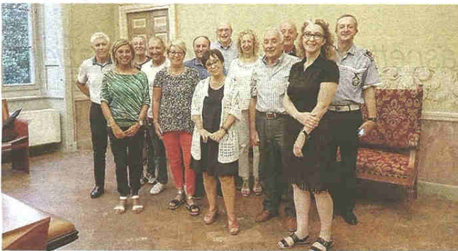
I componenti del terzo gruppo che ha aderito al controllo di vicinato

Terzo gruppo di volontari: vigilerà sulle vie al confine con Busto