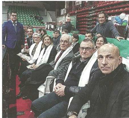
Sindaci e assessori al gran finale di Telethon in Valle

pubblicato il 12/12/2018 a pag. 30; autore: Stefano Di Maria