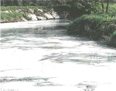
Tornano preoccupanti schiume nel fiume Olona

VALLE OLONA - Fiume Olona sorvegliato speciale. Non soltanto per le schiume e i cattivi odori, adesso anche per i problemi legati alle esondazioni dovuti alla pioggia incessante. L'acqua ormai è a raso: in alcuni punti sembra che stia per trascinare. Sicché, i volontari della protezione civile dei paesi dell'asse del Medio Olona e, ancora, fino a Legnano sono in allerta.