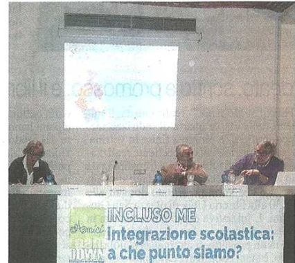
Il convegno promosso da Team Down

pubblicato il 08/11/2018 a pag. 30; autore: Lucia Landoni