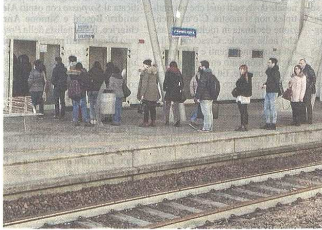
La giornata di disagi ha scatenato parecchie lamentele dei genitori (Bizz)

La tipologia di abbonamento si chiama "Io viaggio in provincia", che permette di viaggiare sui mezzi