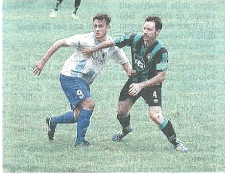
Castellanzese e Besnatese di nuovo faccia a faccia

È diventata in poco tempo una classicissima: Castellanzese-Besnatese due anni fa decise il campionato di Prima Categoria, ora le due squadre si sono ritrovate in Promozione (0-0 e 1-1 in campionato) e oggi in 90' si giocheranno la qualificazione alle semifinali di Coppa Italia (30 marzo e il 13 aprile contro la vincente di Brianza Cernusco-Stezzanese).