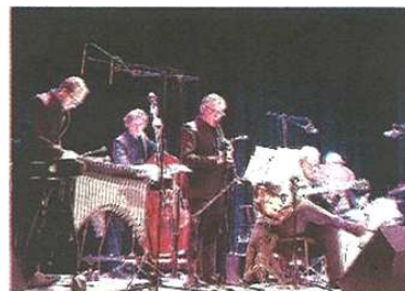
Si parte il 20 ottobre per finire il 24 novembre