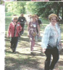
«CACCIA AI TESORI DELLA VALLE OLONA» in centinaia all'ex cotonificio per le tante iniziative proposte per rilanciare l'Ecomuseo. E' stata una manifestazione di grande successo

pubblicato il 23/05/2014 a pag. 53; autore: gmt