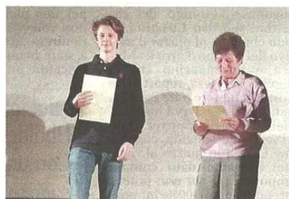
La consegna delle benemeritenze