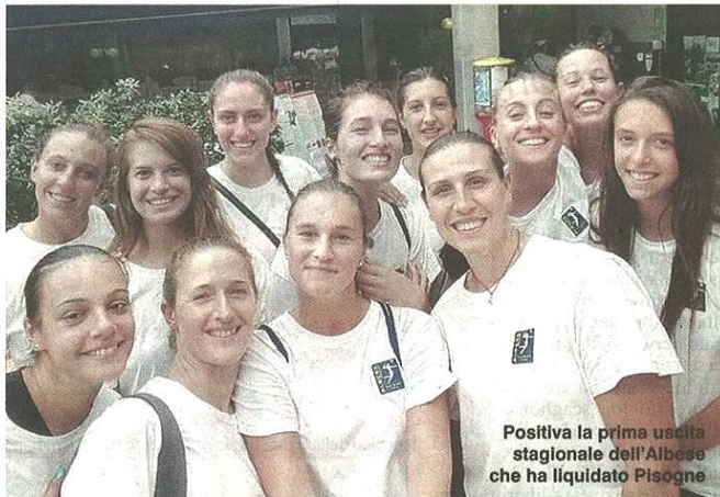
Positiva la prima uscita stagionale dell'Albese che ha liquidato Pisogne

pubblicato il 07/09/2015 a pag. 30; autore: Filippo Cagnardi