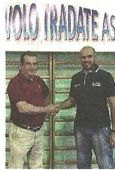
Luigi Uma di Tradate

Per quanto riguarda i gironi "varesini" della prima fase in campo femminile nel quadrangolare H ci sono Villa Cortese, Focol Legnano, Amatori Orago e Luino (sabato la prima giornata con Legnano-Orago e Luino-Villa Cortese), mentre nel quadrangolare I Tradate e Castellanza affronteranno le milanesi Novate e Cusago (si parte con Novate-Tradate e Castellanza-Cusago). Un solo girone, invece, in campo maschile con Sestese e Caronno Pertusella che, nel girone B, se la vedranno con Bresso e Vittorio Veneto (Sestese-Bresso e Vittorio Veneto-Caronno le partite del primo turno).