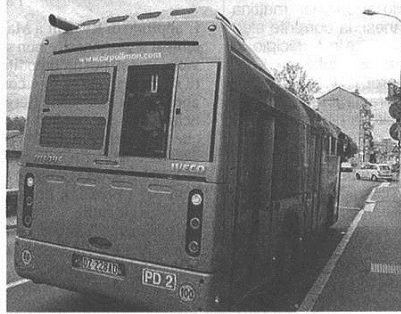
Rincari in vista per il trasporto pubblico locale

publicato il 06/09/2015 a pag. 31; autore: Stefano Di Maria