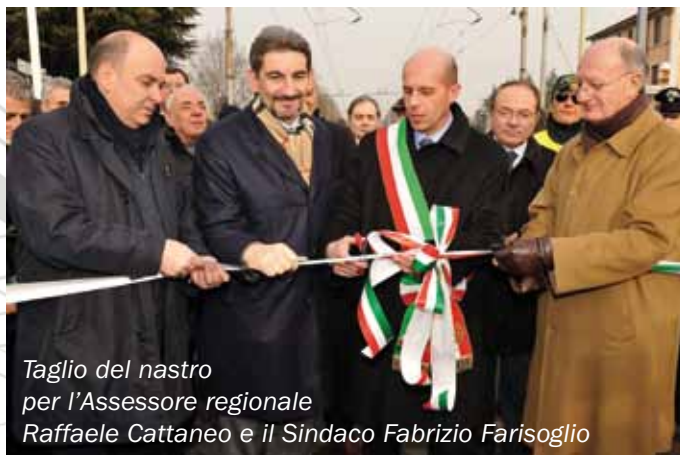
Taglio del nastro per l'Assessore regionale Raffaele Cattaneo e il Sindaco Fabrizio Farisoglio