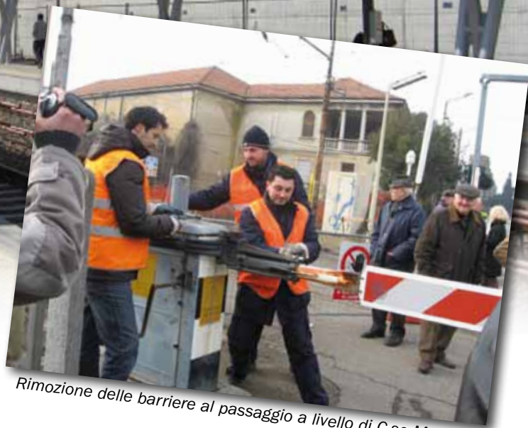
Rimozione delle barriere al passaggio a livello di C.so Matteotti

D a sabato 30 gennaio 2010 Castellanza è a tutti gli effetti una città senza "barriere". E' infatti entrato in funzione il tunnel ferroviario che corre sotto la città e che ha consentito di eliminare definitivamente le barriere dei tre passaggi a livello che da anni tagliavano in due la città. L'effetto della rimozione delle barriere è un traffico che scorre molto più agevolmente in città e il venir meno delle lunghe code di autovetture ferme in attesa del passaggio treni. Ciò consentirà anche una riduzione dell'inquinamento atmosferico prodotto dai gas di scarico delle vetture in coda. Certo, l'entrata in funzione del tunnel ferroviario ha portato con sé lo spostamento della stazione ferroviaria dalla sede storica di piazza XXV Aprile, in pieno centro cittadino, alla nuova sede in via Morelli, alla periferia al confine con il Comune di Busto Arsizio. Uno spostamento che è stato accompagnato dall'attivazione di un servizio di bus navetta per trasportare i passeggeri dal centro cittadino a via Morelli. Il servizio integrato tra Regione Lombardia e Comune di Castellanza è gratuito, è attivo sei giorni su sette, dal lunedì al sabato, e prevede ben 45 corse (con andata e ritorno) dalle 6 del mattino alle 21 di sera. La nuova stazione è in fase di realizzazione e sarà pronta per luglio 2011. Dopo i primi tempi di comprensibile disorientamento dei passeggeri, ora la situazione si sta lentamente normalizzando e comincia ad intravedersi quella che sarà la nuova stazione che dovrà