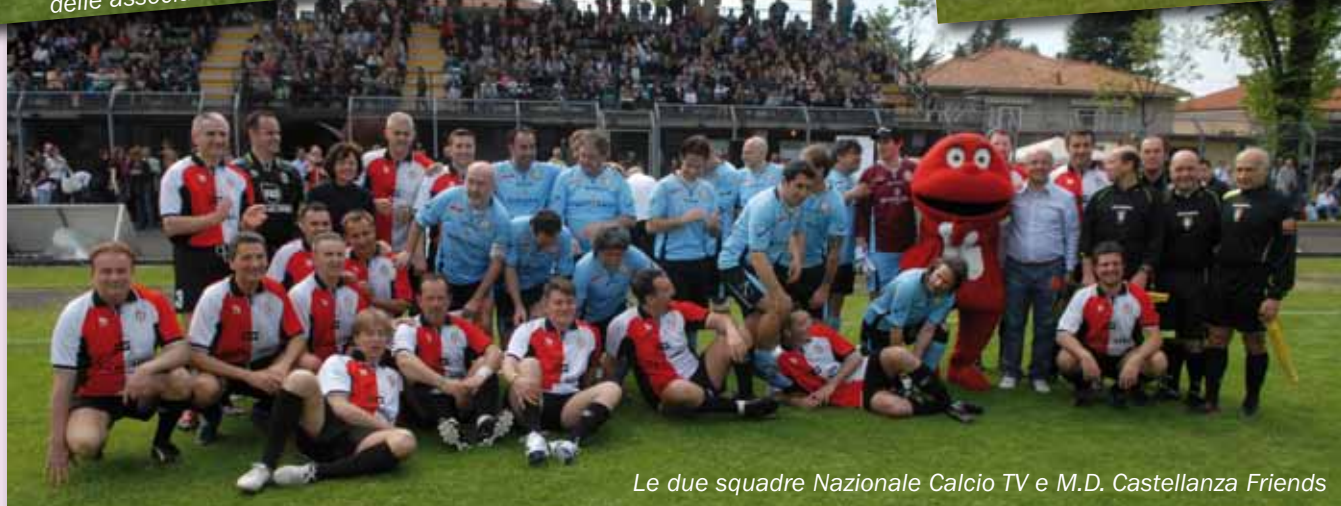
Le due squadre Nazionale Calcio TV e M.D. Castellanza Friends