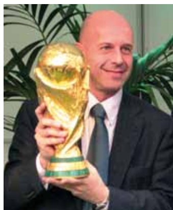
Il Sindaco con la Coppa del Mondo giunta a Castellanza prima di volare in Sudafrica