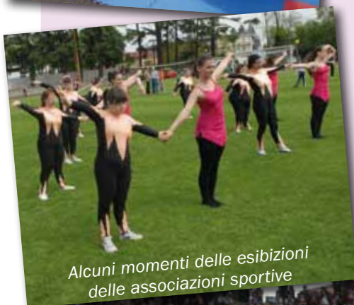
Alcuni momenti delle esibizioni delle associazioni sportive