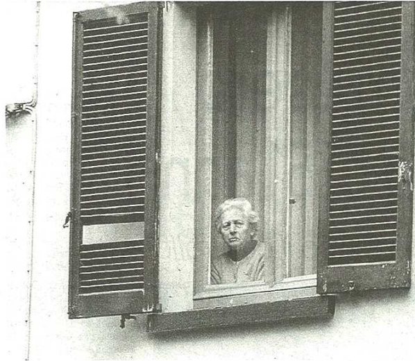
Sono soprattutto gli anziani le vittime dei truffatori: l'attenzione non è mai abbastanza

GLI STRATAGEMMI I più diffusi sono i falsi addetti della Telecom e delle aziende del gas: talvolta muniti di falsi tesserini di riconoscimento, entrano con la scusa di dover controllare qualche impianto; mentre un complice distrae l'ignara vittima, l'altro fa il giro delle stanze mettendo nel sacco denaro e gioielli. Ci sono poi i veri rappresentanti che, con modi gentili e spiegazioni affrettate, riescono a far sottoscrivere contratti capestro, per rescindere i