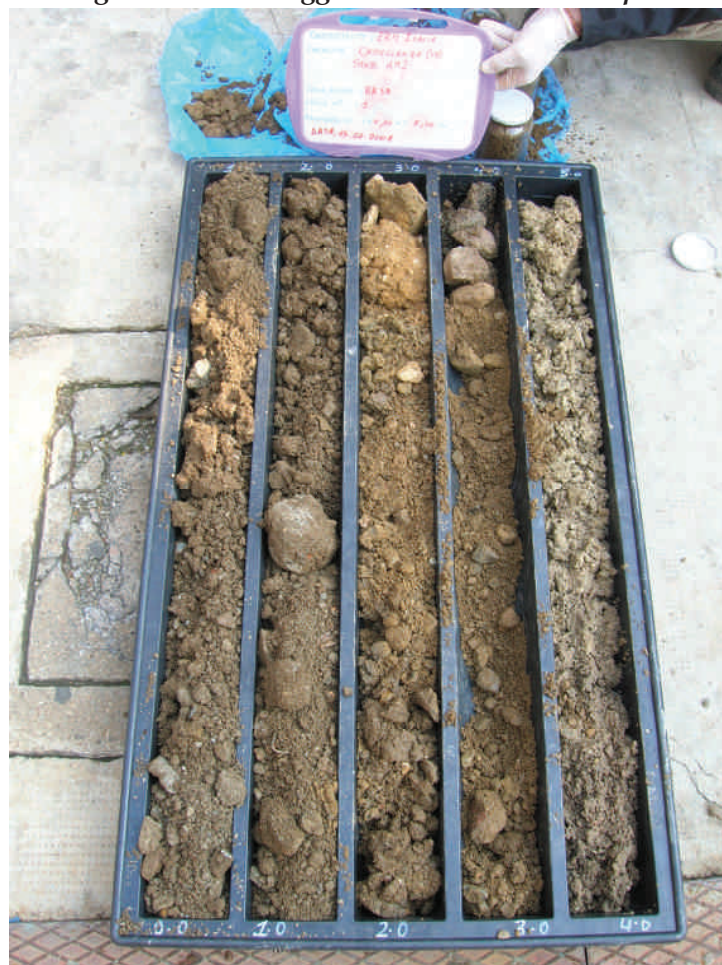
Figura. 21 Sondaggio BH38 da 0 a 5 m da p.c.