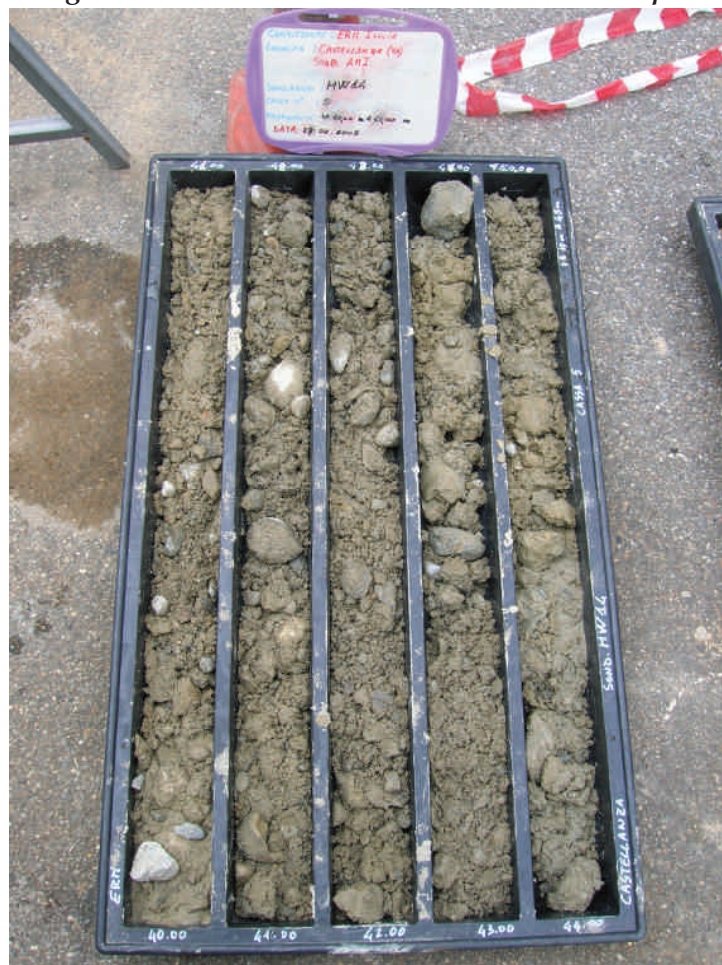
Figura. 71 Piezometro MW14 da 40 a 45 m da p.c.