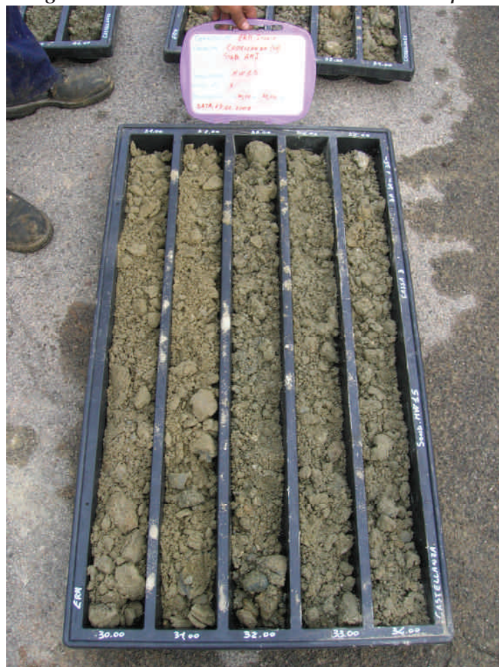
Figura. 77 Piezometro MW15 da 30 a 35 m da p.c.