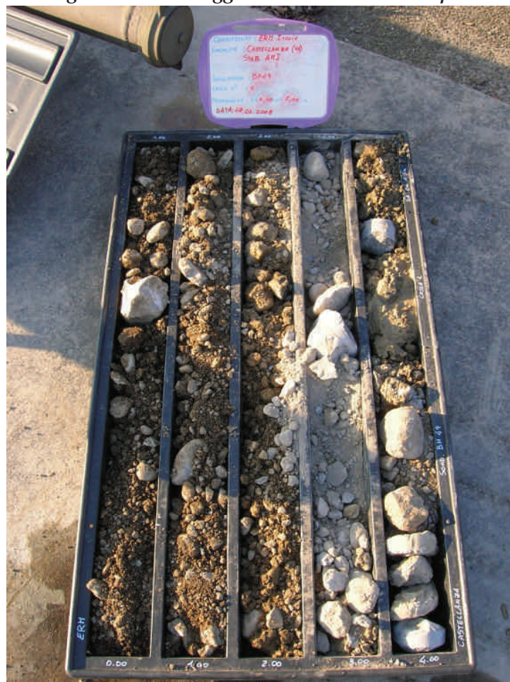
Figura. 43 Sondaggio BH49 da 0 a 5 m da p.c.