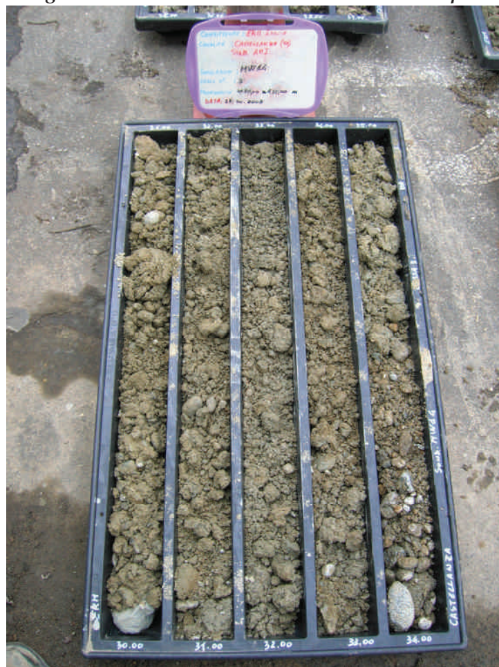
Figura. 69 Piezometro MW14 da 30 a 35 m da p.c.