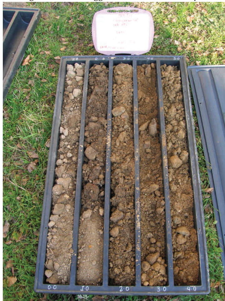
Figura. 55 Sondaggio BH55 da 0 a 5 m da p.c.