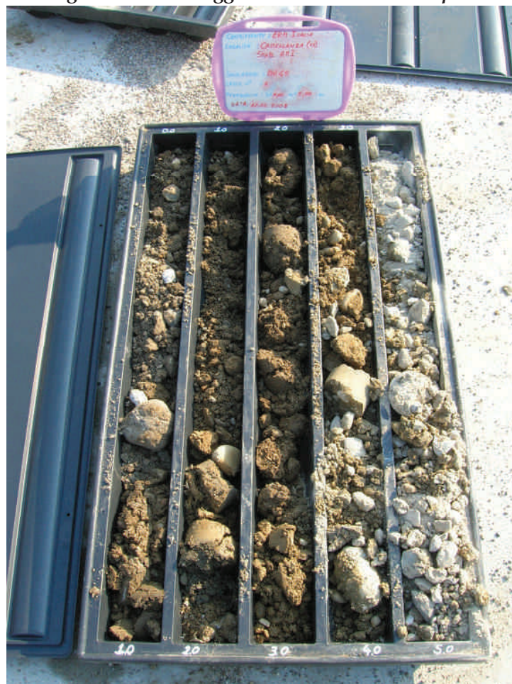
Figura. 35 Sondaggio BH45 da 0 a 5 m da p.c.