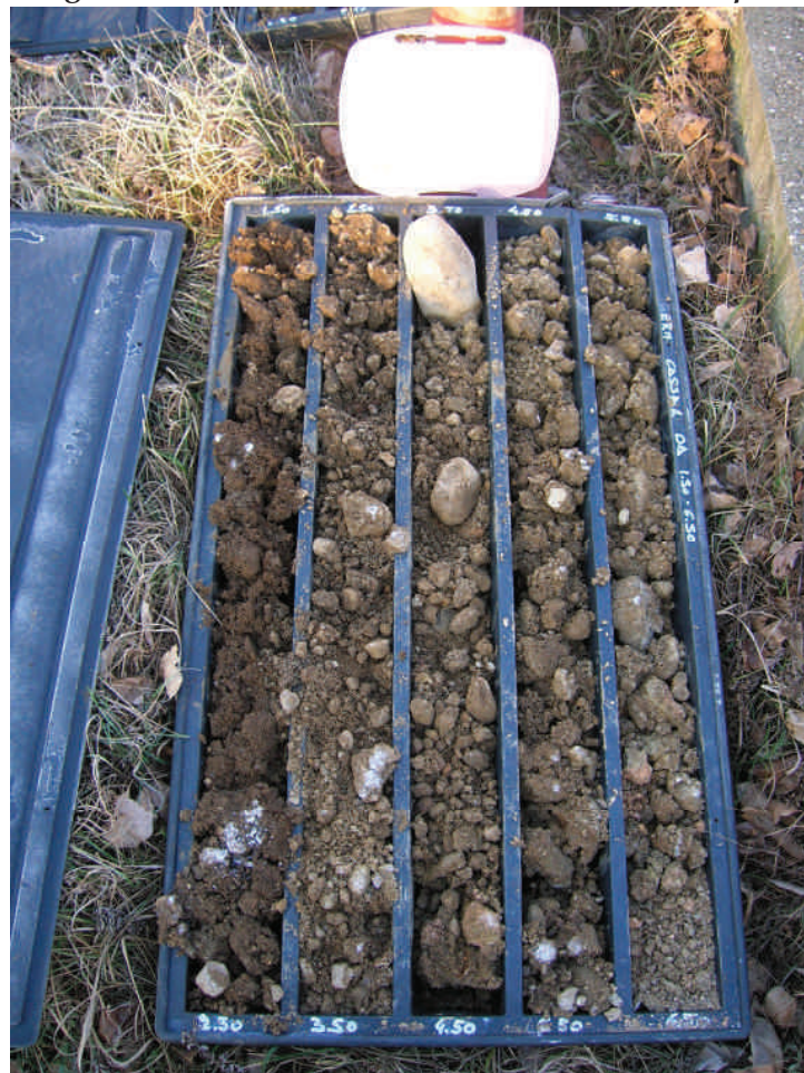
Figura. 99 Piezometro MW19 da 1,5 a 6,5 m da p.c.