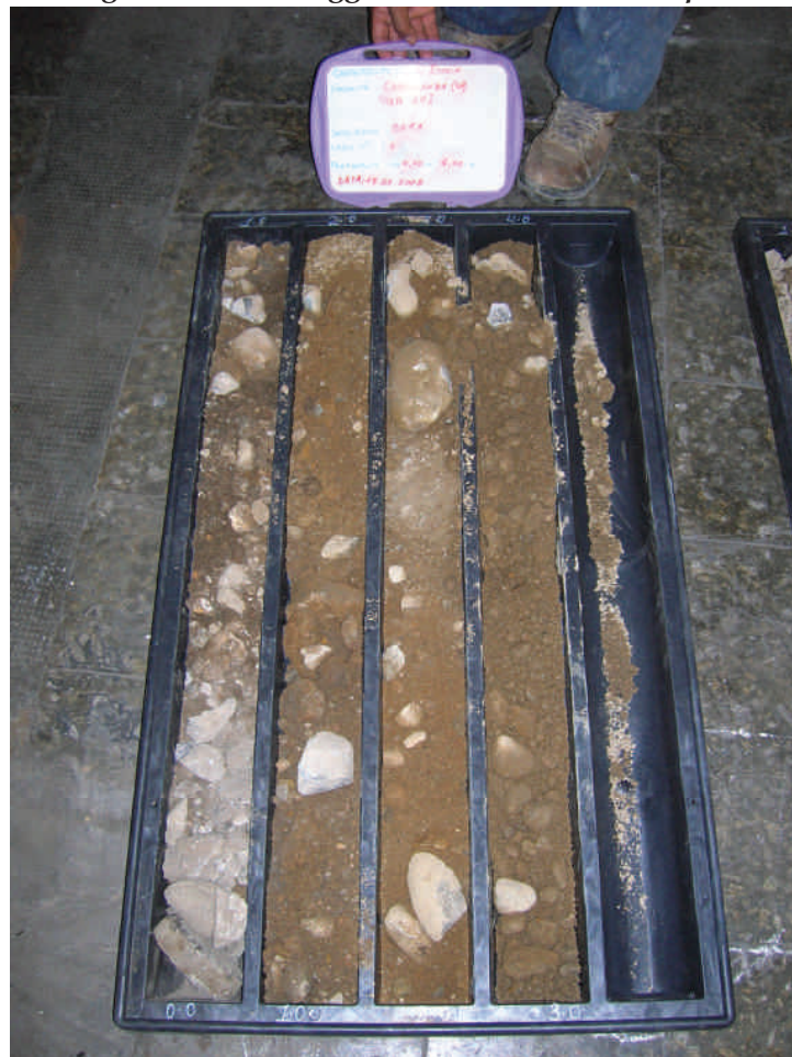
Figura. 61 Sondaggio BHE1 da 0 a 4 m da p.c.