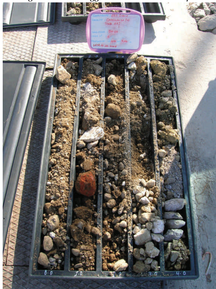
Figura. 25 Sondaggio BH40 da 0 a 5 m da p.c.