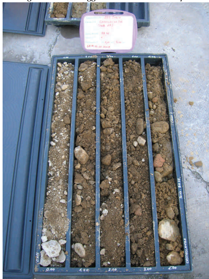
Figura. 17 Sondaggio BH36 da 0 a 5 m da p.c.