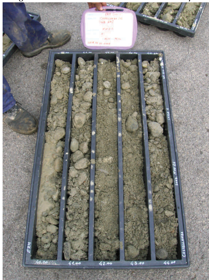
Figura. 79 Piezometro MW15 da 40 a 45 m da p.c.