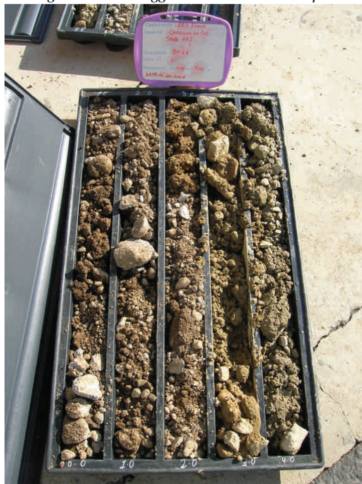
Figura. 27 Sondaggio BH41 da 0 a 5 m da p.c.