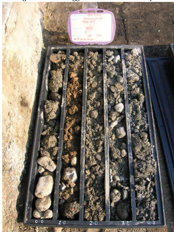
Figura. 5 Sondaggio BH30 da 0 a 5 m da p.c.