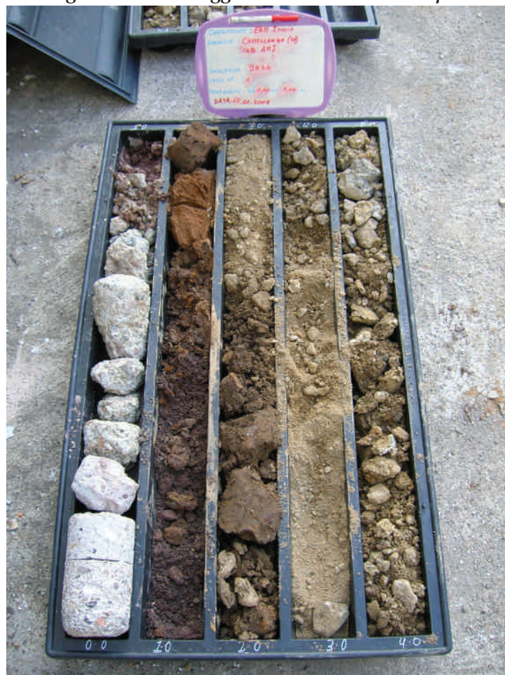
Figura. 11 Sondaggio BH33 da 0 a 5 m da p.c.