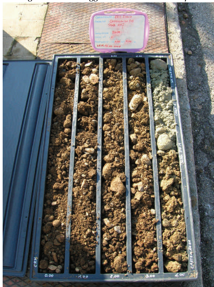
Figura. 23 Sondaggio BH39 da 0 a 5 m da p.c.