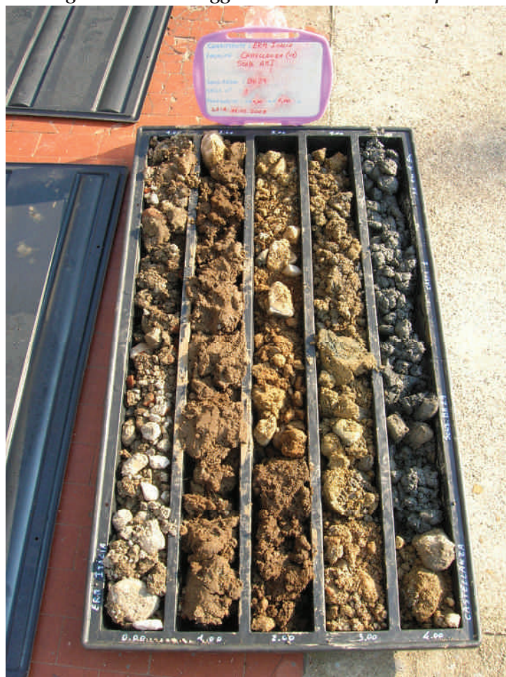
Figura. 3 Sondaggio BH29 da 0 a 5 m da p.c.