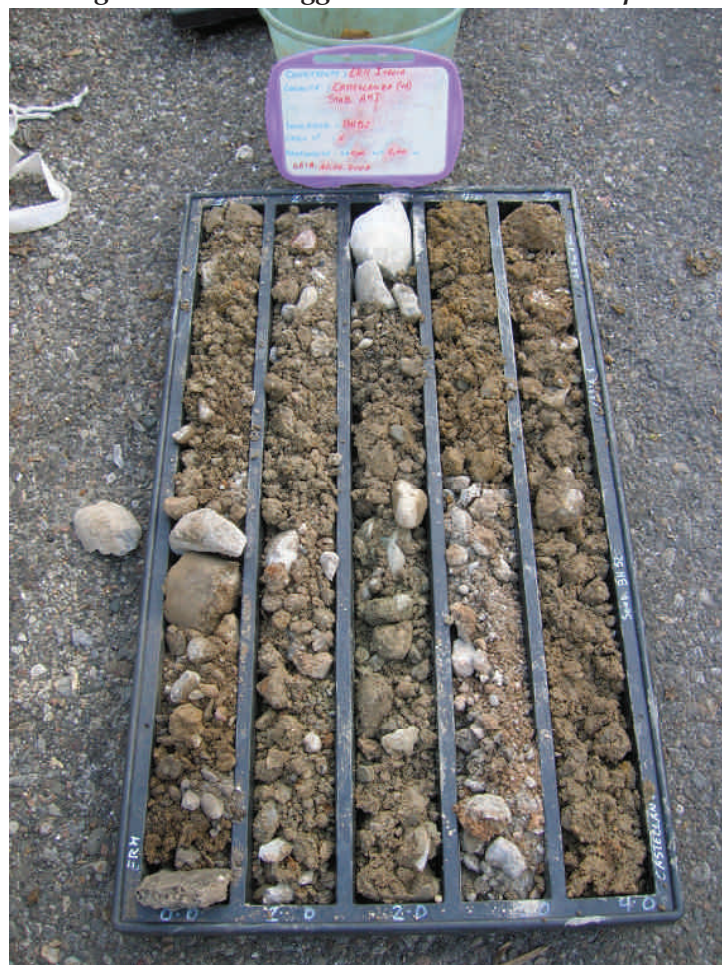
Figura. 49 Sondaggio BH52 da 0 a 5 m da p.c.