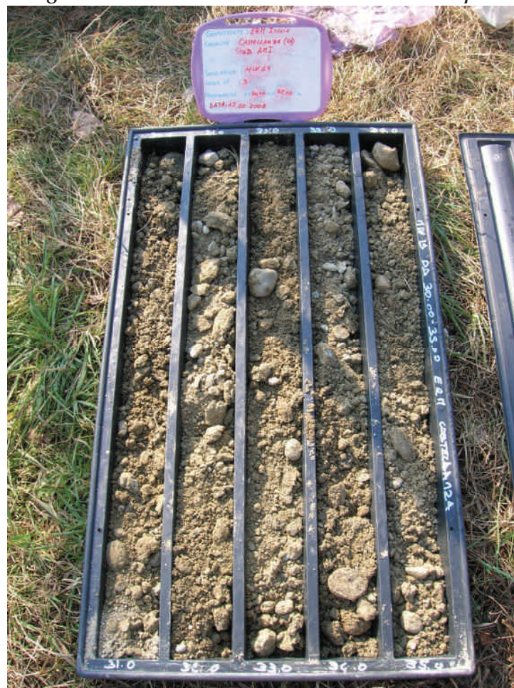
Figura. 101 Piezometro MW19 da 30 a 35 m da p.c.