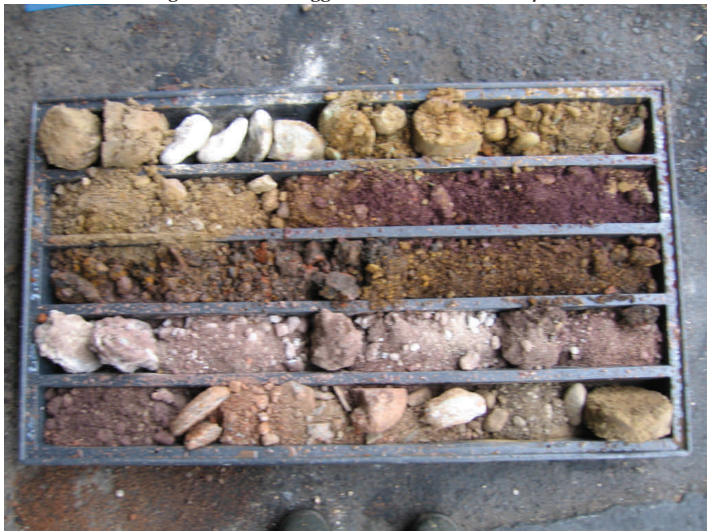
Figura. 7 Sondaggio BH31 da 0 a 5 m da p.c.