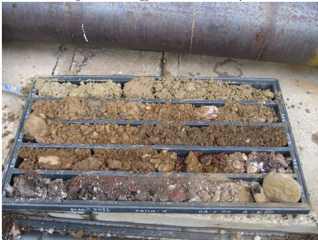
Figura. 57 Sondaggio BH56 da 0 a 5 m da p.c.