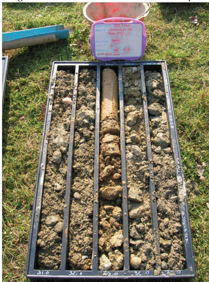
Figura. 105 Piezometro MW20 da 30 a 35 m da p.c.