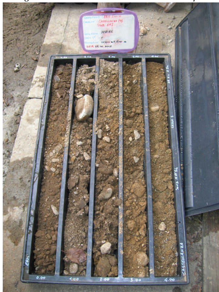
Figura. 67 Piezometro MW14 da 0 a 5 m da p.c.