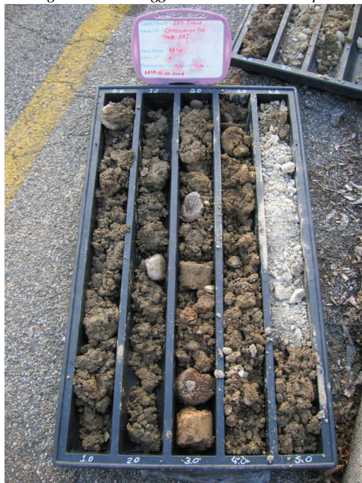
Figura. 53 Sondaggio BH54 da 0 a 5 m da p.c.