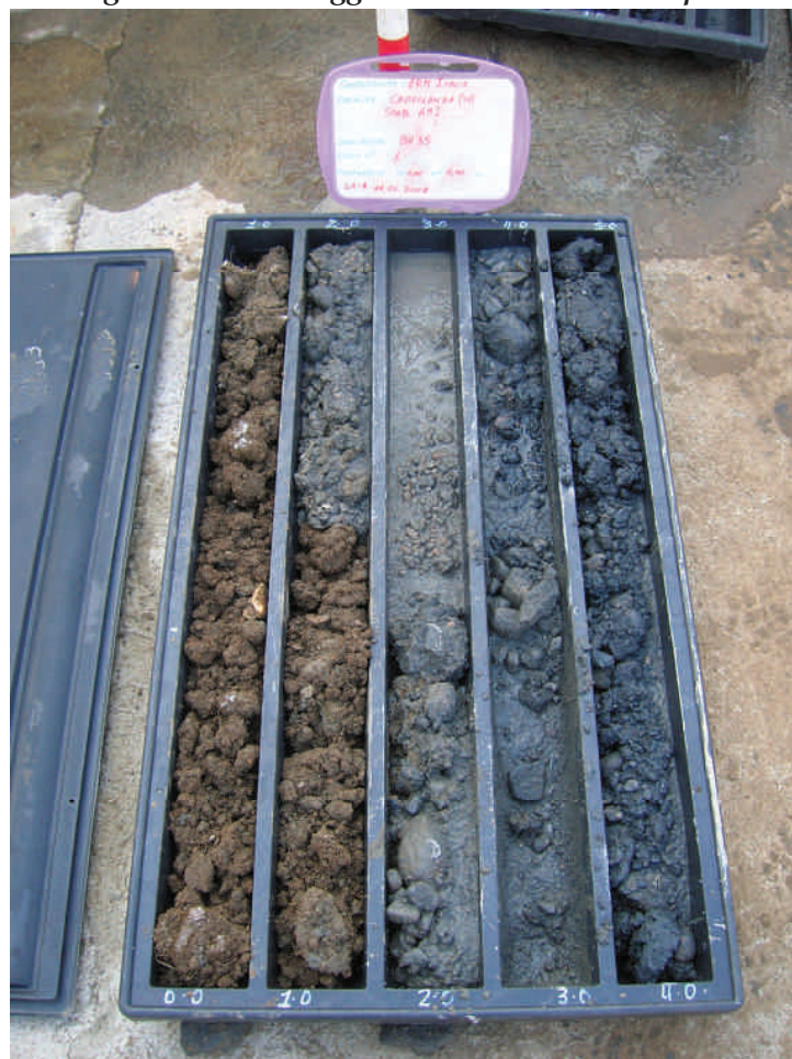
Figura. 15 Sondaggio BH35 da 0 a 5 m da p.c.