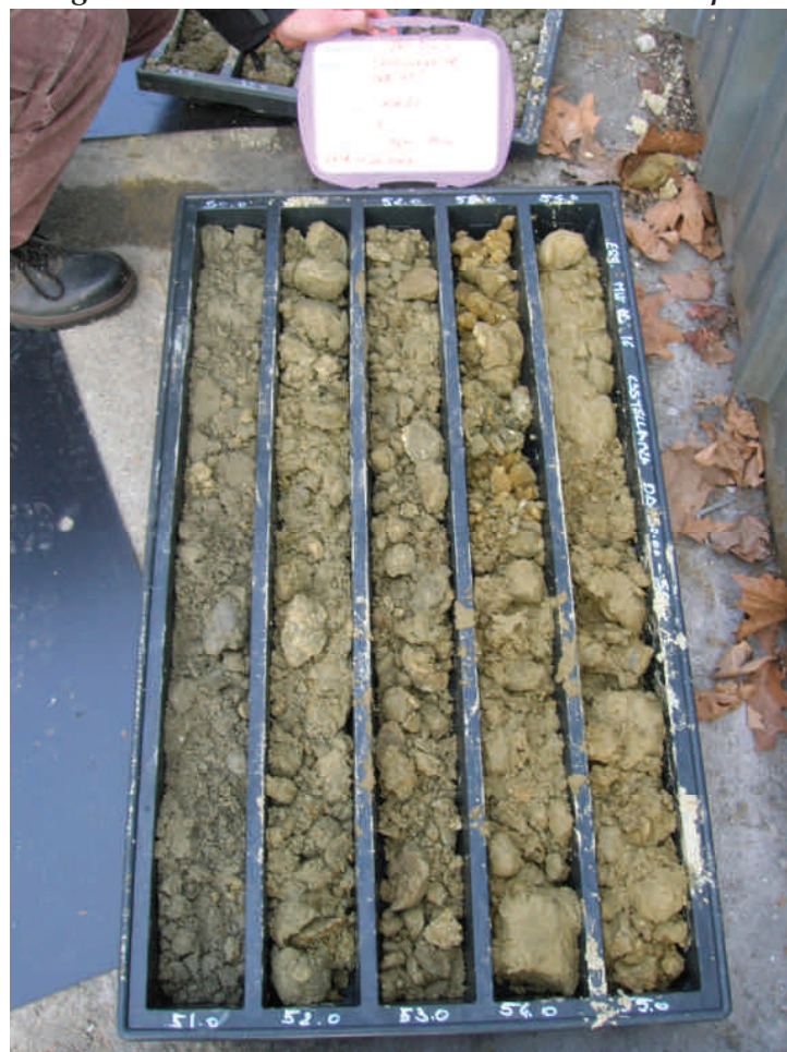
Figura. 89 Piezometro MW16 da 50 a 55 m da p.c.