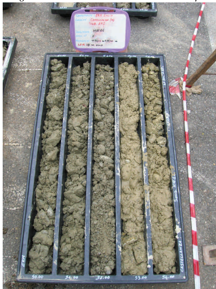
Figura. 73 Piezometro MW14 da 50 a 55 m da p.c.