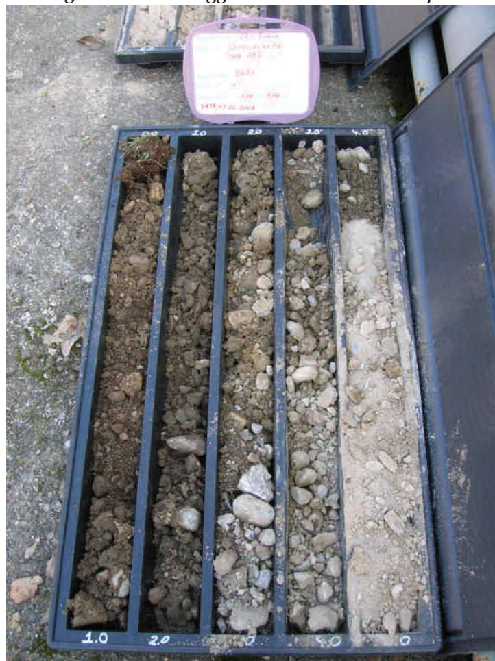
Figura. 47 Sondaggio BH51 da 0 a 5 m da p.c.