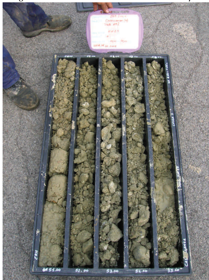
Figura. 81 Piezometro MW15 da 50 a 55 m da p.c.