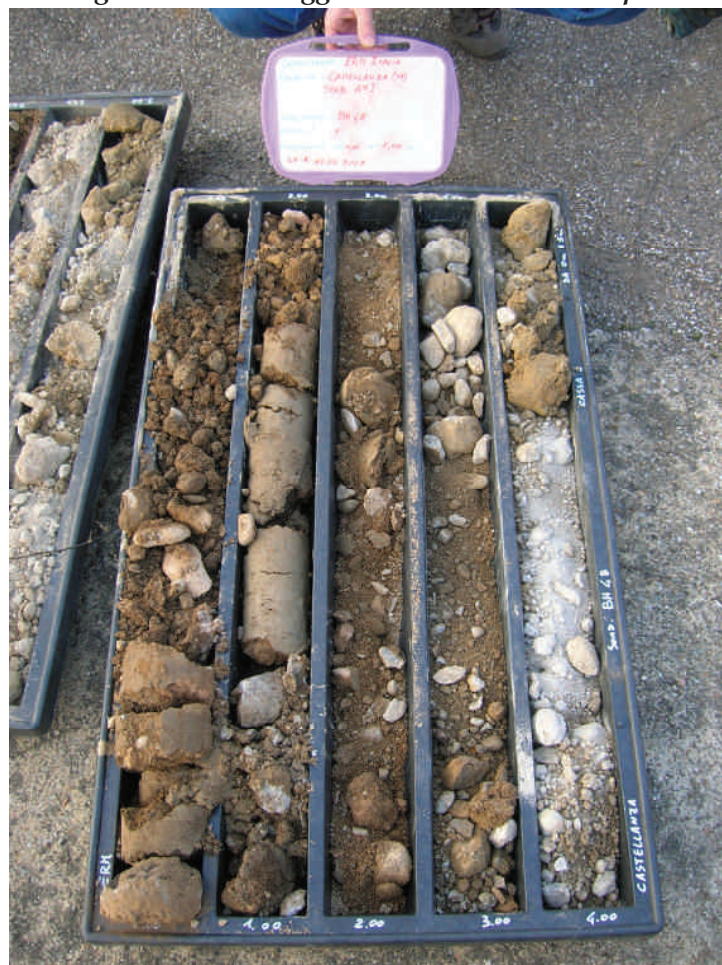
Figura. 41 Sondaggio BH48 da 0 a 5 m da p.c.