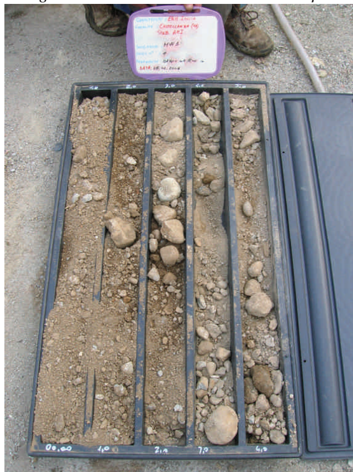
Figura. 91 Piezometro MW17 da 0 a 5 m da p.c.