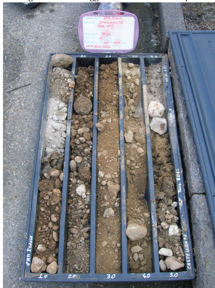
Figura. 33 Sondaggio BH44 da 0 a 5 m da p.c.