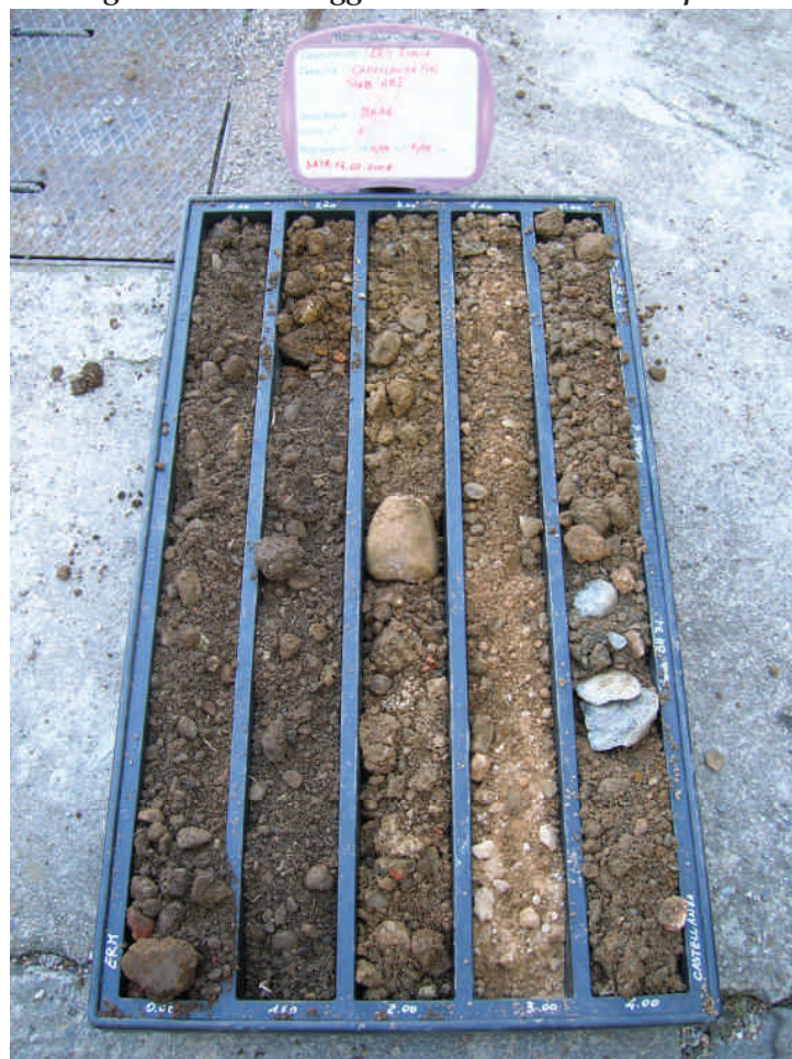
Figura. 13 Sondaggio BH34 da 0 a 5 m da p.c.