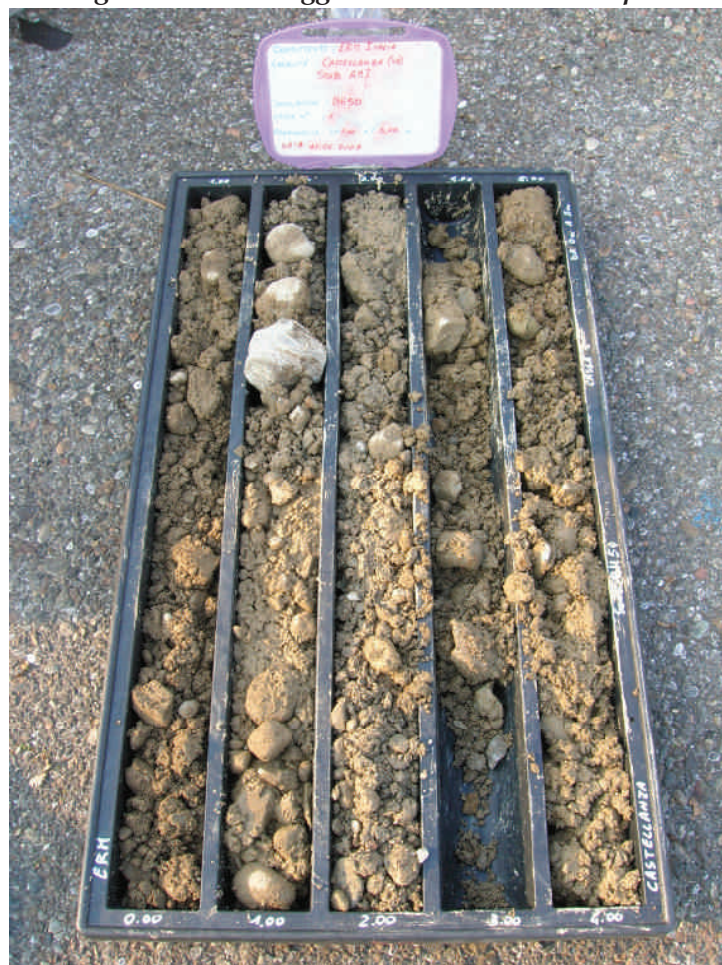
Figura. 45 Sondaggio BH50 da 0 a 5 m da p.c.