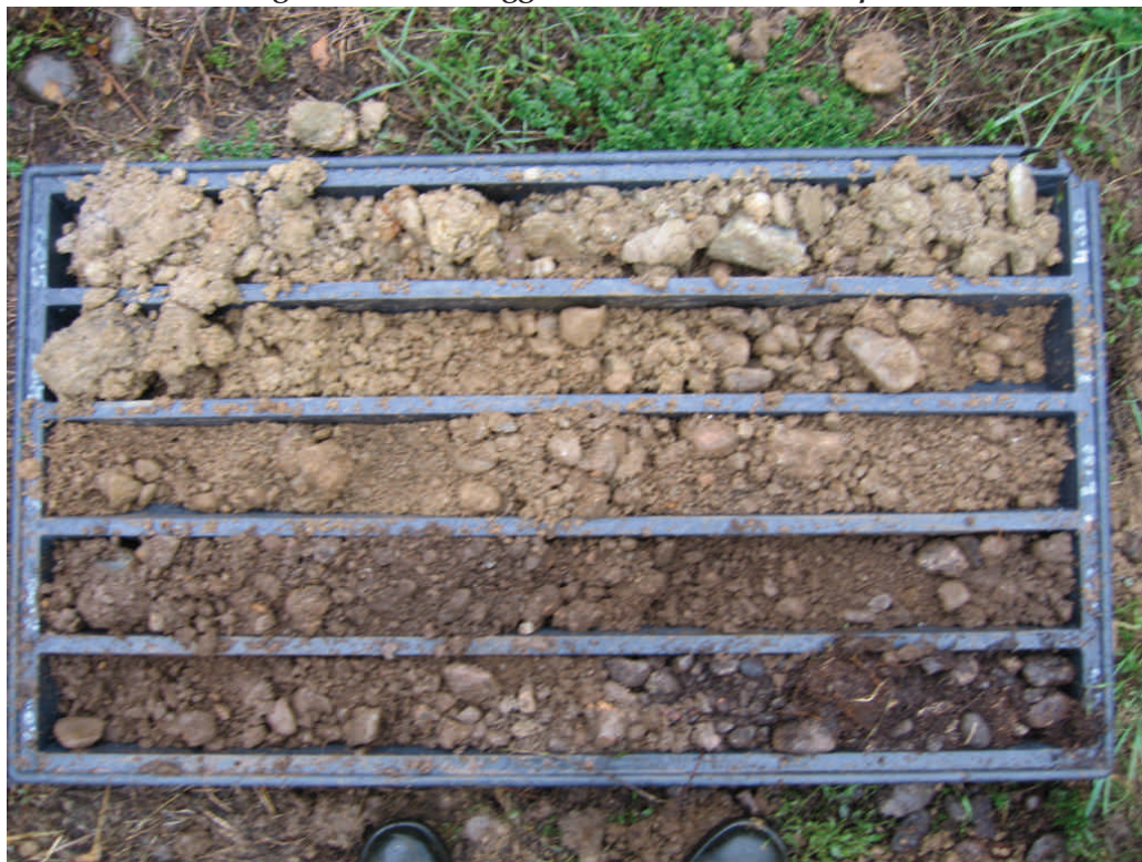
Figura. 59 Sondaggio BH57 da 0 a 5 m da p.c.