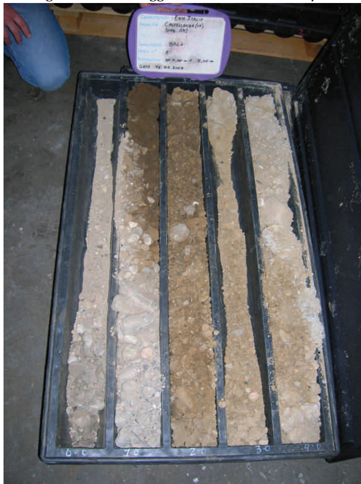
Figura. 31 Sondaggio BH43 da 0 a 5 m da p.c.