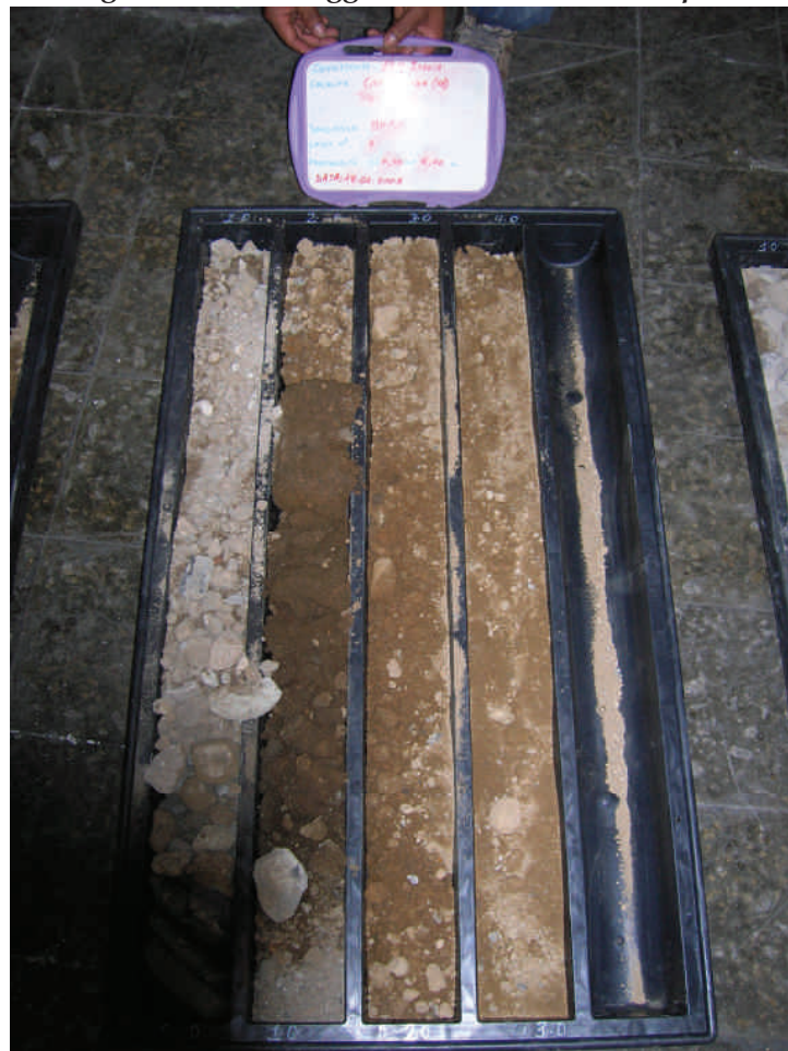
Figura. 63 Sondaggio BHE3 da 0 a 4 m da p.c.