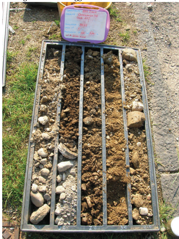
Figura. 29 Sondaggio BH42 da 0 a 5 m da p.c.