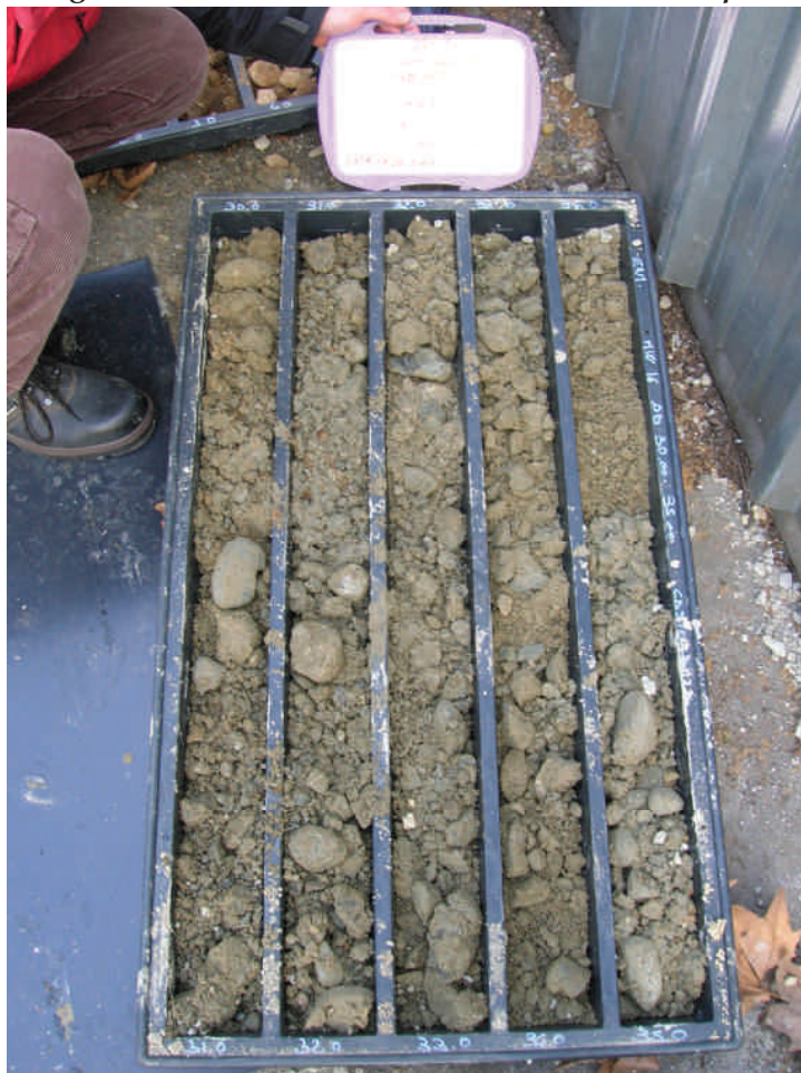
Figura. 85 Piezometro MW16 da 30 a 35 m da p.c.