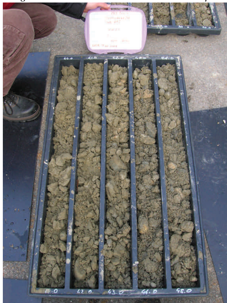
Figura. 87 Piezometro MW16 da 40 a 45 m da p.c.