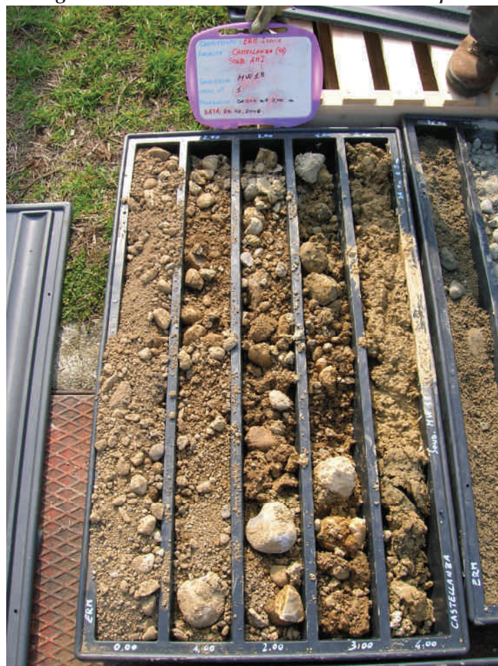
Figura. 95 Piezometro MW18 da 0 a 5 m da p.c.