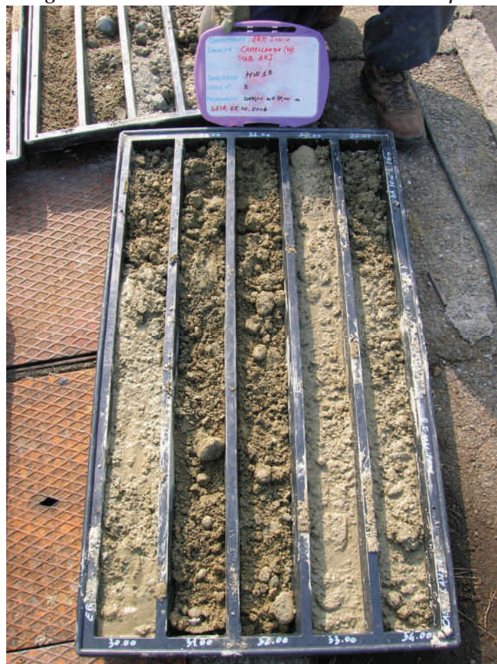
Figura. 97 Piezometro MW18 da 30 a 35 m da p.c.