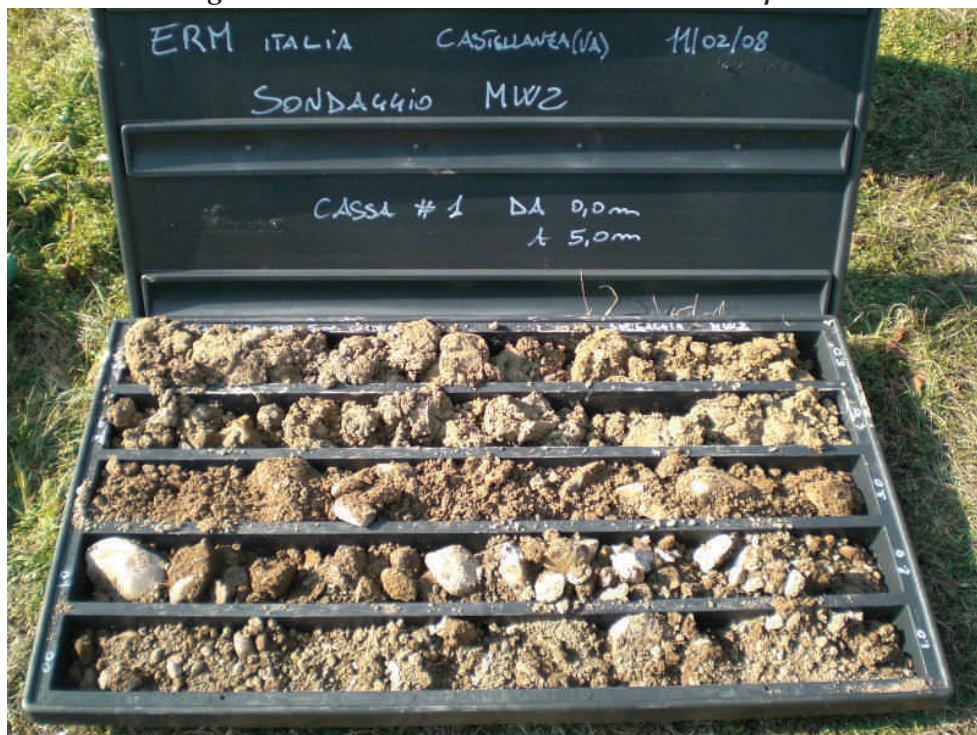
Figura. 103 Piezometro MW20 da 0 a 5 m da p.c.