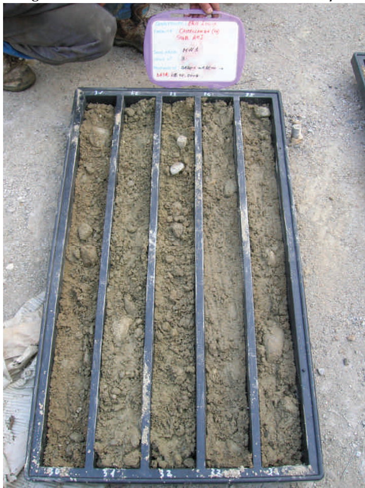
Figura. 93 Piezometro MW17 da 30 a 35 m da p.c.