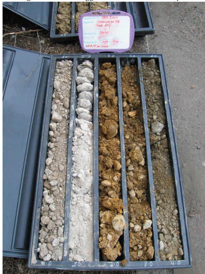
Figura. 9 Sondaggio BH32 da 0 a 5 m da p.c.