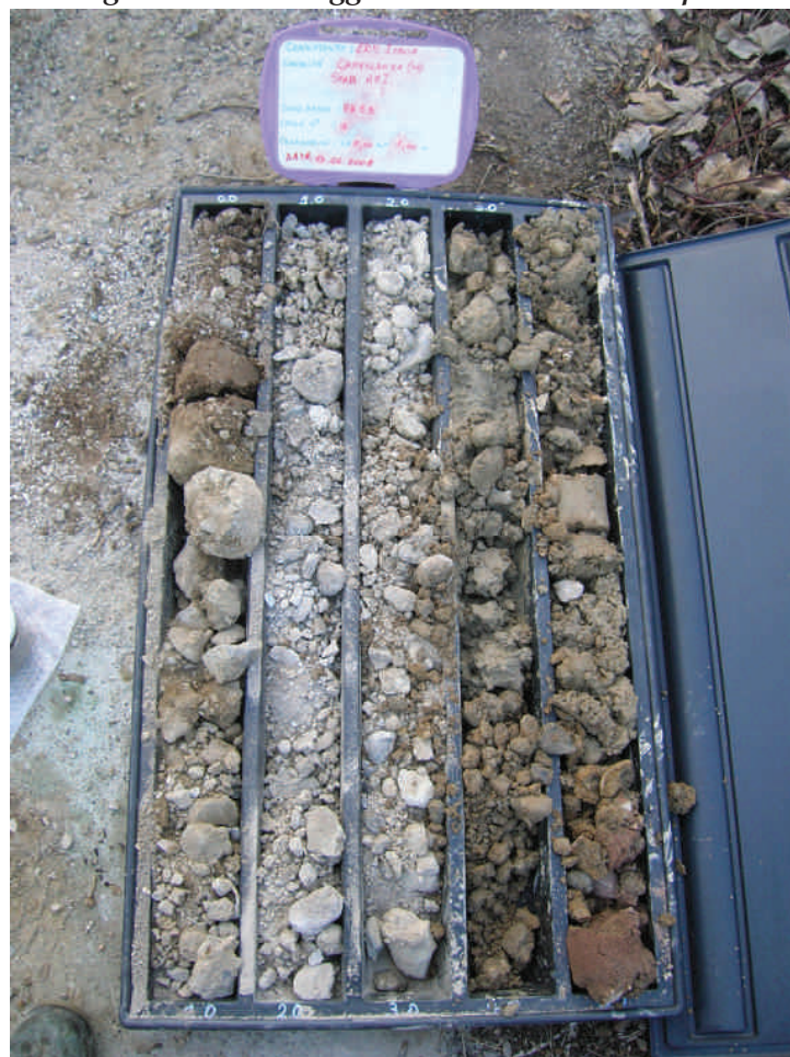
Figura. 51 Sondaggio BH53 da 0 a 5 m da p.c.