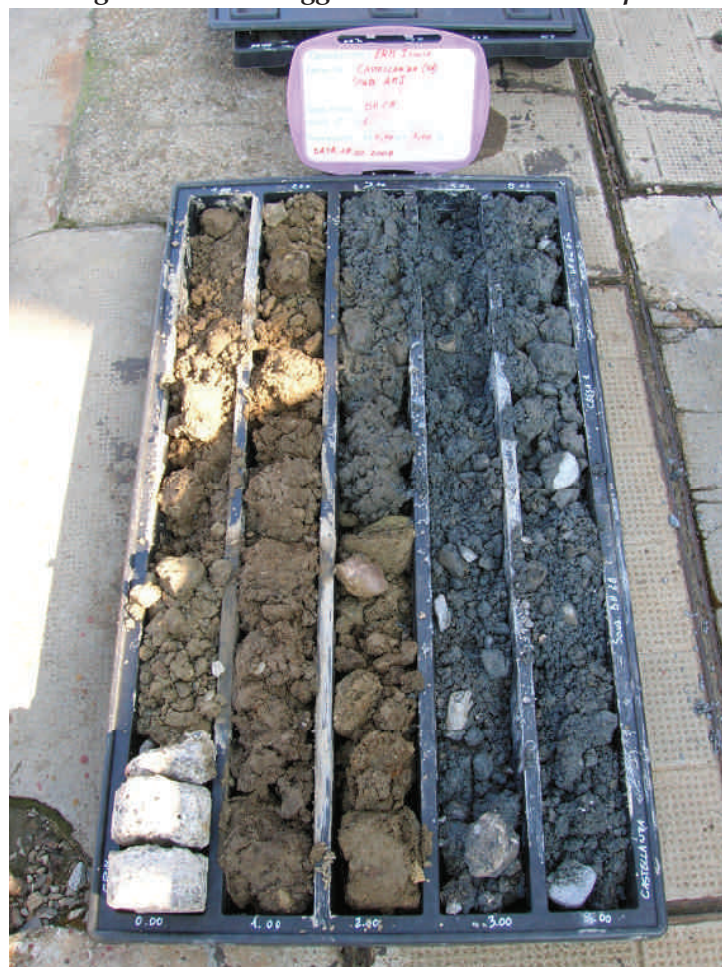
Figura. 1 Sondaggio BH28 da 0 a 5 m da p.c.