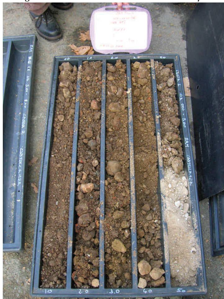
Figura. 83 Piezometro MW16 da 0 a 5 m da p.c.