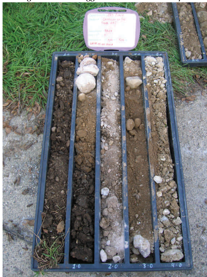
Figura. 39 Sondaggio BH47 da 0 a 5 m da p.c.