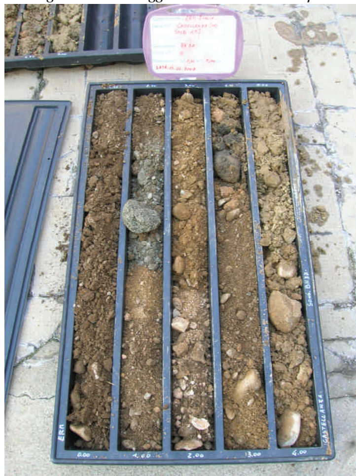
Figura. 19 Sondaggio BH37 da 0 a 5 m da p.c.