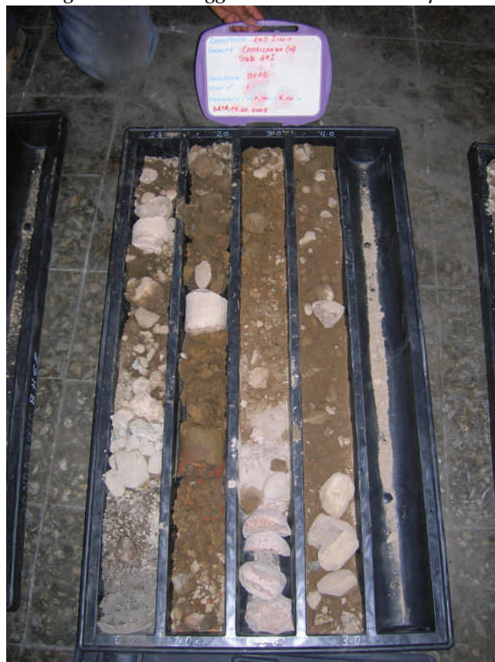
Figura. 65 Sondaggio BHE5 da 0 a 4 m da p.c.