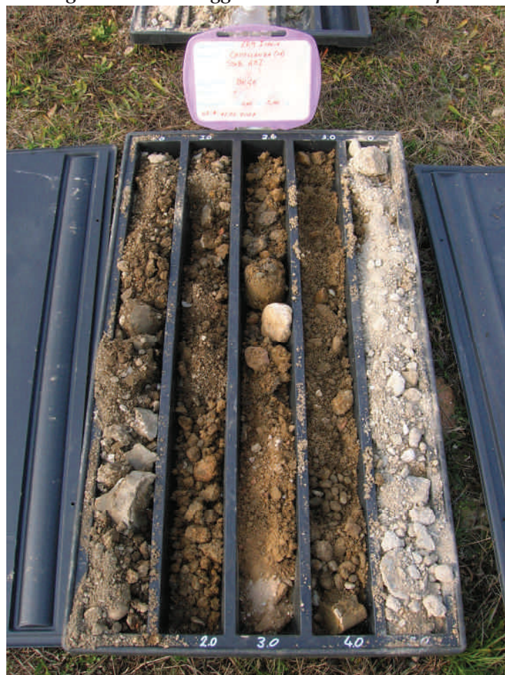
Figura. 37 Sondaggio BH46 da 0 a 5 m da p.c.