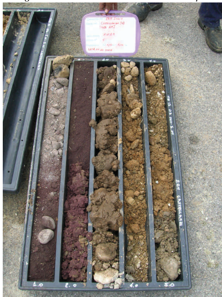
Figura. 75 Piezometro MW15 da 0 a 5 m da p.c.