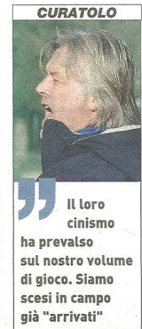
Il loro cinismo ha prevalso sul nostro volume di gioco. Siamo scesi in campo già "arrivati"