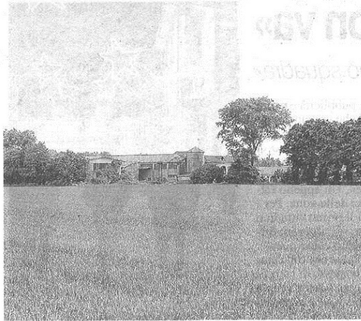
L'area tra Cerro e Rescaldina dove dovrebbe sorgere Ikea

pubblicato il 20/12/2014 a pag. 38; autore: Stefano Vietta