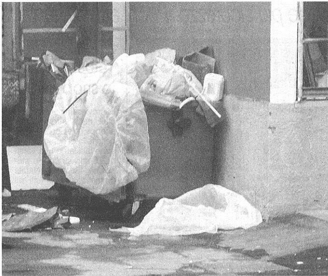
Troppi rifiuti al parcheggio dell'ex Esselunga, grave degrado. Interviene l'amministrazione

CASTELLANZA – Accertamenti e ispezioni per far rispettare la raccolta differenziata ai cinesi del centro commerciale dell'ex Esselunga. Tutto nasce da un'esperienza del sindaco Fabrizio Farisoglio : nel consiglio comunale di venerdì, rispondendo a una richiesta di chiarimenti del consigliere Mino Caputo sul degrado nel parcheggio che guarda sulla Saronnese, ha raccontato che «sono andato a fare acquisti e, quando ho visto l'area di sosta, mi è preso un colpo. C'era chiaramente bisogno di intervenire per insegnare ai cinesi come separare la spazzatura, regolamentare il carico e scarico merci e agire sulla parte retrostante, quella messa decisamente peggio». Insomma, è emerso in modo indiscutibile che non c'era il rispetto delle regole della differenziata, cosicché il primo cittadino ha fatto effettuare un sopralluogo dall'Ufficio Tecnico, affinché svolgesse un'opera di sensibilizzazione e sollecito nel diversificare e depositare i rifiuti in modo ordinato. In effetti Caputo aveva