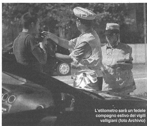
L'etilometro sarà un fedele compagno estivo dei vigili valligiani