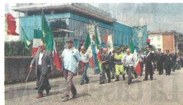
La cerimonia di inaugurazione del monumento ai carabinieri tenutasi sabato nei giardini di viale Rimembranze

del comandante provinciale dei carabinieri, il colonnello Alessandro De Angelis. «Grazie per l'affetto che ci state dimostrando oggi - ha concluso il colonnello - Noi siamo a vostra disposizione, non abbiate mai paura di chiamarci». La cerimonia si è