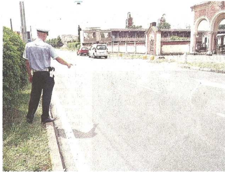
INCIDENTE Un agente della Polizia locale fa i rilievi sul luogo dove il 18enne si è gettato sotto il Suv

A Castellanza un 18enne di Marnate è spuntato all'improvviso da dietro un cespuglio ed è finito sotto la vettura condotta da una mamma di 41 anni che aveva con sé i figli. Il ragazzo è gravissimo, la famiglia è sotto choc