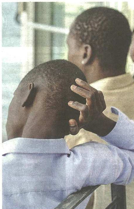
Nell'ultimo decennio il numero di stranieri che hanno scelto di stabilirsi a Castellanza è triplicato: da poco più del 2 per cento, la quota è salita oltre il 7 per cento

pubblicato il 27/08/2016 a pag. 31; autore: Stefano Di Maria