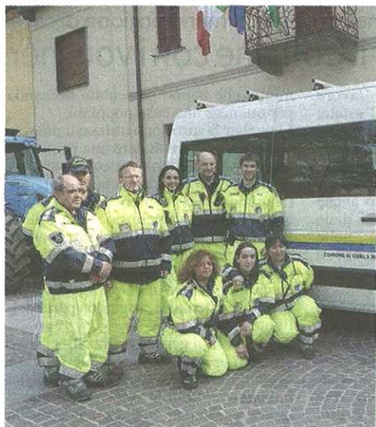
Il gruppo della Protezione civile di Gorla Minore