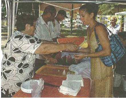
Festa dell'anguria, ogni anno si ripete la tradizione (Bnlz)

CORTE DEL CILIEGIO Grigliata, giochi e musica per stare insieme