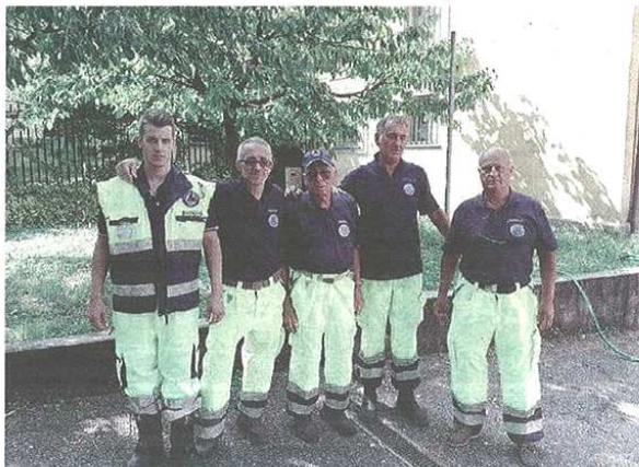
Il gruppo di Protezione civile ringrazia i castellanzesi per la generosità

C'è grande soddisfazione per la partecipazione dei castellanzesi, che hanno risposto in breve tempo portando grandi quantità di beni. «Hanno dimostrato tutti un grande cuore», è il commento dei volontari della Protezione civile impegnati nella raccolta. Tutti i materiali e generi alimentari verranno consegnati ai centri di smistamento. Intanto si ipotizza una seconda raccolta, che potrebbe tenersi a breve a seconda delle esigenze manifestate dalle Protezione civile nazionale. Castellanza e gli altri Comuni della Valle dovrebbero anche stanziare dei fondi: un euro per ogni abitante, come proposto nei giorni scorsi. Successo dell'iniziativa anche nella vicina Olgiate Olona.