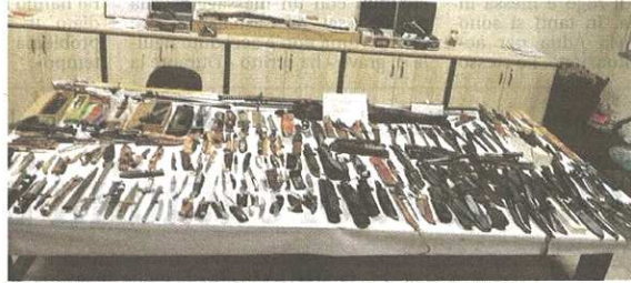
Le armi trovate dai carabinieri di Castellanza a casa dell'operaio 60enne

I militari sono intervenuti all'interno dell'abitazione dell'uomo insieme ai Vigili del fuoco e ai tecnici della azienda sanitaria locale a causa di un perdurante e intenso odore sgradevole, proveniente dall'interno dell'appartamento, che era stato segnalato da numerosi condomini. Una volta all'interno è stato accertato che la puzza era causata da condizioni igienico sanitarie inadeguate. Nel corso del-