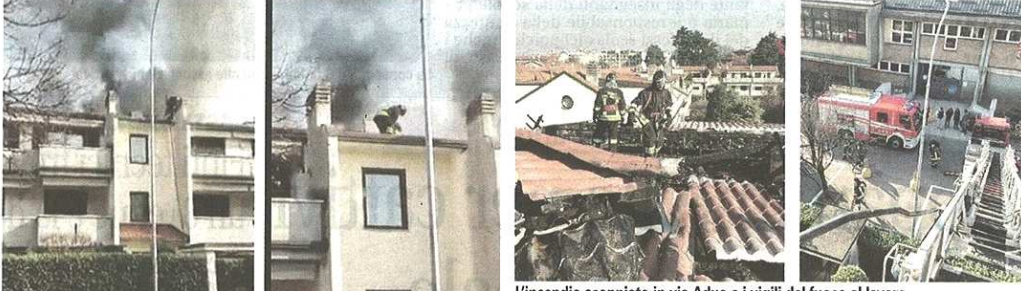
L'incendio scoppiato in via Adua e i vigili del fuoco al lavoro

CASTELLANZA (pil) Tanta paura e attimi di tensione quando nella tarda mattina di ieri, giovedì, alcuni residenti hanno notato delle fiamme da un tetto di un'abitazione di via Adua. L'allarme è scattato verso le 12 e sul posto sono state inviate le squadre dei vigili del fuoco, che si sono messi subito al lavoro per spegnere le fiamme e mettere in sicurezza l'abitazione. Secondo quanto ricostruito a prendere fuoco è stata la copertura di un condominio di due piani. Al lavoro diciassette vigili del fuoco sono intervenuti dalle sedi di Busto/Gallarate, Legnano e Inveruno con cinque automezzi :