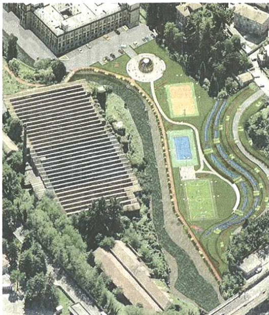
BOSCO CANTONI il progetto di come diventerà l'area

stra volontà a rendere quest'area una zona vivibile da tutti, è una sorta di ipoteca sullo sviluppo futuro della città». Il «Bosco Cantoni» prevede la creazione di un nuovo accesso veicolare sullo sbocco di via Piola in piazza Castagnate, la realizzazione di una pista ciclabile che arriverà in prossimità del ponte sull'Olona, e il recupero di alcuni edifici per diversi scopi. Prevista la creazione di un polo sportivo integrato al campus universitario e aperto a tutti i cittadini, e la realizzazione di terrazzamenti per un accesso pedonale anche dalla parte alta della città, oltre a un giardino botanico aperto al pubblico. Come spiega Frigoli, il progetto è un'idea generale, che dovrà essere vagliata e realizzata con il tempo, in base alle risorse a disposizione. «In questi sei mesi muoveremo i primi passi, provvederemo alle demolizioni e pulizia dell'area verde», afferma l'assessore, annunciando che è già stato siglato l'accordo di programma che vede in questo progetto, al fianco del Comune di Castellanza, anche Regione, Provincia e Università. L'intento è quello di creare uno spazio in città che sia punto d'incontro, dove trovare servizi e passare il tempo. Anche per questo motivo sono stati invitati tutti i cittadini a mandare i propri suggerimenti e idee all'indirizzo boscocantoni@comune.castellanza.va.it , nessun concorso ma un «pensatoio verde» per progettare insieme gli spazi della propria città.