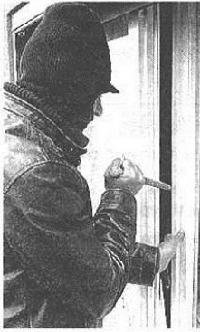
Ladri ancora in azione

CASTELLANZA - Ladri in azione in un appartamento di corso Matteotti. Hanno curato la famiglia spesso assente per lavoro tant'è che i padroni di casa, ieri pomeriggio, hanno trovato porte aperte, finestra divelta e casa sottosopra. Bottino in oro e preziosi pari a qualche centinaio di euro. I malviventi cercavano invece gioielli e denaro contante. La proprietaria quando è arrivata nell'appartamento si è subito resa conto che c'era qualcosa di strano: appena entrata ha visto la tapparella del balcone sollevata in modo strano e la portafinestra aperta. Ma il vero disastro lo ha trovato in camera da letto: armadi aperti e cas-