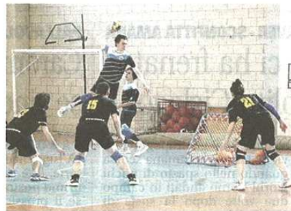
In alto a sinistra: il saluto tra Killer Whales e Shogun e a destra, un attacco della squadra caronnese. Sotto: Minamoto e Dolphins al centro del campo.