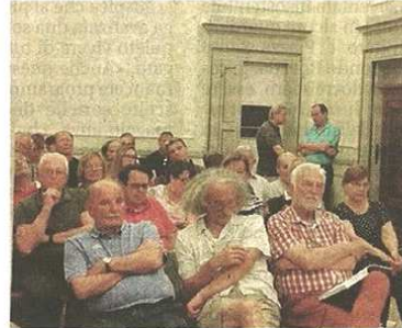
L'incontro con i residenti del Buongesù

prima fra tutti quella della sicurezza per cui è stata richiesta una ricalibrazione dei tempi dei semafori. Come ha affermato da Cerini l'incontro più che politico era tecnico, proprio per capire le reali esigenze del territorio e per arrivare a una soluzione adeguata. «Voglio sottolineare gli aspetti pratici degli interventi. Siamo in una condizione per cui ogni euro va speso con logica, vogliamo avere la certezza che questo intervento su via Firenze vada bene per risolvere, almeno per ora, il problema e andare incontro alle necessità dei cittadini». E così è stato fatto. Dopo un'ora e mezza di incontro pubblico, la conferma che il piano su via Firenze verrà attuato, come soluzione nell'immediato, in attesa della famosa rotonda, che resterà, almeno per ora, e per cause di forza maggiore, in un cassetto.