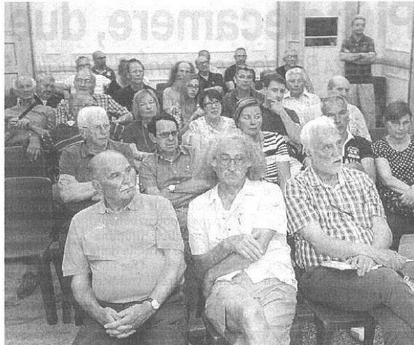
Il pubblico presente all'assemblea sulla zona del Buon Gesù

Per quanto riguarda la rotonda, non è esclusa dai programmi del nuovo esecutivo, «tuttavia serve reperire i fondi - ha precisato Cerini - oltre a un accurato studio viabilistico i cui tempi non saranno brevi».