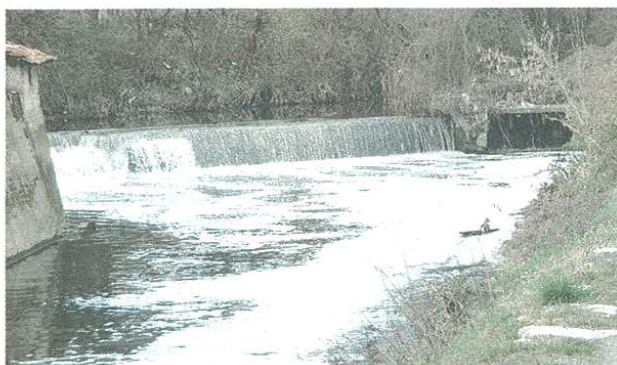
CHIAZZE Schiume comparse durante le ultime settimane nel fiume