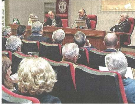
Pienone per l'incontro con Toni Capuozzo al Cesil

CASTELLANZA - Tutto esaurito alla presentazione del libro di Toni Capuozzo "Il segreto dei marò": giovedì sera la sala congressi del Cesil si è riempita di persone interessate a conoscere l'autore, noto giornalista del Tg5, e ad ascoltarlo presentare la sua inchiesta sul caso dei due fucilieri di Marina (tema di stretta attualità proprio in questi giorni). Di fronte alla vasta platea (in prima fila era schierata l'Associazione Marinai d'Italia, oltre a esponenti politici di tutta la zona), Michele Mancino ha introdotto così Capuozzo: «Un giornalista equidistante, che esamina i fatti al di sopra delle parti, facendo nel caso dei marò la cronologia dei fatti senza sue interpretazioni, lasciando il giudizio al lettore». Orgoglioso della partecipazione, «malgrado la