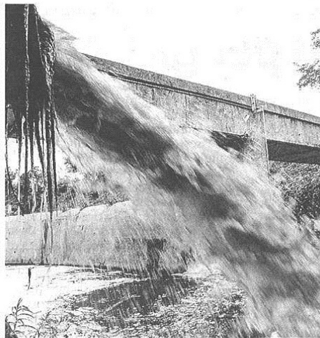
Il fiume Olona inquinato attende azioni dalla politica

pubblicato il 18/12/2017 a pag. 20; autore: Marco Linari