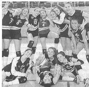
Festa vittoria per la Futura Giovani

D FEMMINILE GIRONE C Vittoria e primato per Busto. Sorridono anche Insubria e Rho