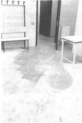
Negli spogliatoi è stato sparso ovunque il contenuto degli estintori. Le porte dotate di reti sono state segate con appositi strumenti

CASTELLANZESE Raid notturno anche negli spogliatoi. Cerini: «Questo non è sport»