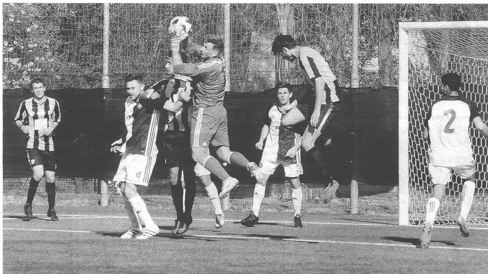
Chiodi in uscita alta: per la Castellanzese è stata una partita difficilissima quella contro il Mariano che già aveva sconfitto il Legnano

NOTE Ammoniti: Raimondi (C), Mantegazza (C), Gibellini (C), Colombo (C), Cesaro (C), Cassamagnaga (M), Zorloni (M), Sironi (M).