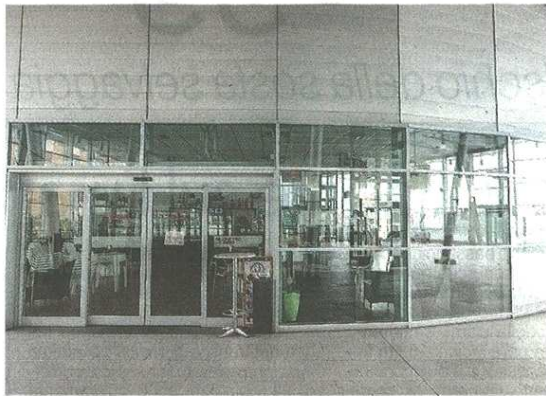
La chiusura del bar della stazione ha sollevato parecchie polemiche

DISAGI ALLE FNM L'azienda corre ai ripari, anche per il bar