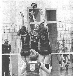
Maspero e il muro di Castellanza

D FEMMINILE GIRONE C Castellanza s'arrende a Rho, Insubria a mani vuote, Cassano ok