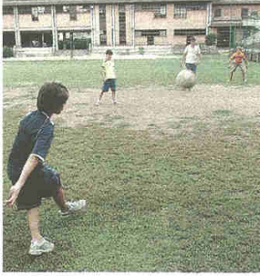
L'oratorio feriale al Sacro Cuore (Bilz)

Metà dei fondi a San Giuseppe, l'altra al Sacro Cuore. Riconosciuta la funzione sociale