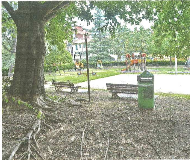
Giardini di via Cantoni alle prese con le intemperanze di molti frequentatori

La castellanese ha deciso di lanciare il suo appello attraverso La Prealpina dopo che, a distanza di mesi dalla fine del lockdown, sono stati tolti i sigilli ai giochi: «C'è qualche altalena rotta e qualche scivolo in pessimo stato», afferma: «Come se non bastasse, spesso troviamo cocci di vetro sparsi sull'erba, pericolosi per i bambini in caso di caduta, e anche degrado».