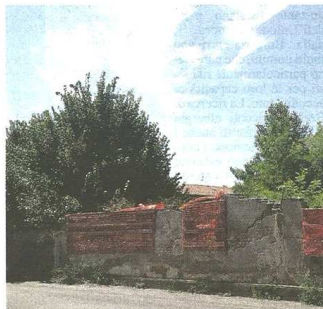
«Sembra che le pareti stiano per crollare da un momento all'altro»

CASTELLANZA - «Venite a vedere. Nell'ex convitto Cantoni è cresciuto un bosco». È l'ultima segnalazione dei residenti delle zone limitrofe al sito dismesso, che da anni chiedono di far partire la riqualificazione. In effetti, al progetto sulla carta non è seguita l'attuazione: è da dieci anni che si aspetta vengano concretizzate palazzine e piccoli negozi, con una piazzetta al centro. Un'attesa inutile perché l'operatore non interviene e, malgrado i continui tentativi del Comune (per altro trattando una diminuzione delle volumetrie), è rimasto tutto fermo.