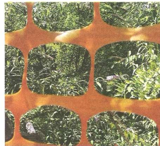
I rifiuti che si notano dietro le recinzioni attirano i topi. La struttura è in stato di totale abbandono dal 1988

l'auto nelle vie laterali lanciando dal finestrino sacchi di spazzatura. C'è poi chi si ferma e, complice il buio, butta oltre le recinzioni dai pezzi di legno ai calcinacci, dai sacchi neri contenenti l'indifferenziata a plastica e vetro: tutta immondizia celata dalla vegetazione, cresciuta rigogliosa grazie alle temperature favorevoli e alla piogge abbondanti. Di qui le preoccupazioni per le condizioni igienico-sanitarie. Quando c'erano stati i primi scarichi abusivi, il Comune aveva prontamente provveduto a far rimuovere tutto dalla proprietà, ma purtroppo la maleducazione non ha fine.