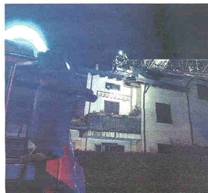
L'intervento dell'altra sera sul tetto di una palazzina affacciata su corso Europa a Gorla Maggiore