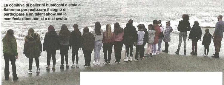
La comitiva di ballerini bustocchi è stata a Sanremo per realizzare il sogno di partecipare a un talent show ma la manifestazione non si è mai svolta

pubblicato il 12/02/2020 a pag. 28; autore: Carlo Colombo