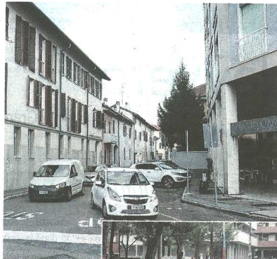
In alto via Roma, l'unica strada in cui la pedonalizzazione viene giudicata non impossibile, qui accanto la via San Camillo

«L'unica strada che si potrebbe pedonalizzare è via Roma» afferma l'assessore ai Lavori pubblici, Claudio Caldiroli: «Lo abbiamo effettivamente ipotizzato, essendoci molti servizi come l'ufficio postale e il distretto sanitario, ma i commercianti hanno espresso parere negativo: vivono del traffico di passaggio e, comprensibilmente, rischierebbero di chiudere». Certo non ci sono molti parcheggi, ma via Roma si trova chiusa fra le aree di sosta di via Garibaldi, via Ponchirolì e piazza Libertà. «In ogni caso abbiamo in programma la sua valorizzazione attraverso la modifica dell'arredo urbano, in particolare dell'illuminazione pubblica» annuncia il