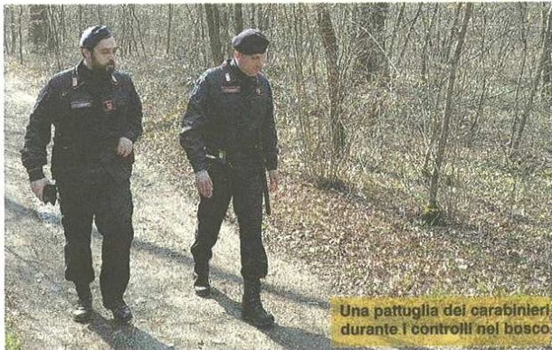
Una pattuglia dei carabinieri durante i controlli nel bosco

LA POLEMICA Vialeto replica a Soragni: così spaventa