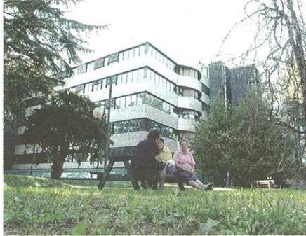
Le vasche volano sono previste al parco dei Platani

Vito Speroni (Fratelli d'Italia) prende posizione sulle vasche volano anti-allagamenti