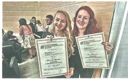
Il rapporto è stato realizzato da AlmaLaurea, il consorzio che raggruppa 76 università italiane, e premia anche dal punto di vista degli stipendi