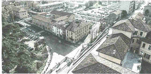
Un'immagine dall'alto mostra la Costalunga, altro percorso pieno di pericoli

CASTELLANZA - Quali sono le vie e gli incroci più pericolosi della città? Sul fronte della sicurezza, l'Amministrazione in carica ha cominciato a mettere mano su diversi punti, ma il traffico di attraversamento a Castellanza è notevole e sono ancora molti i nodi da sbrogliare. La mappa delle strade e degli incroci più a rischio fa riferimento soprattutto al corso Matteotti. A cominciare dall'intersezione con via Piave: è qui che i cittadini chiedono una rotonda al posto dell'incrocio semaforico, sia per i tempi d'attesa sia per gli incidenti (soprattutto per chi svolta da via Piave a sinistra). Fino a quando non verrà acquisito il sedime della vecchia stazione, tuttavia, la rotonda rimarrà una chimera. C'è poi il tratto di corso Matteotti in ingresso da Legnano, dove si corre parecchio malgrado il dosso all'altezza della Liuc. Sempre in corso Matteotti c'è poco da fare per le trasgressioni degli imprudenti al volante: c'è chi, provenendo dalla parallela via 29 Maggio