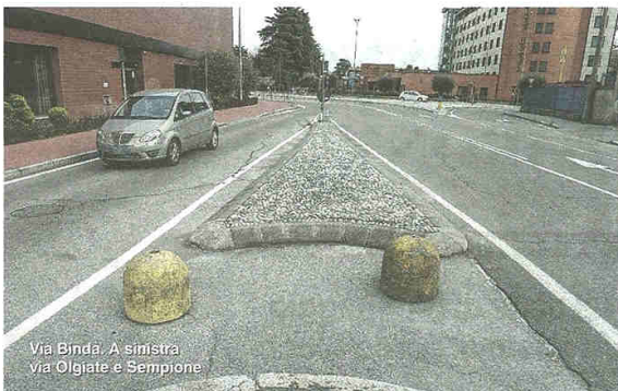
Via Binda. A sinistra via Olgiate e Sempione