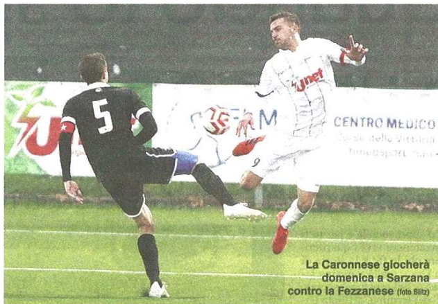
La Caronnesse giocherà domenica a Sarzana contro la Fezzanese