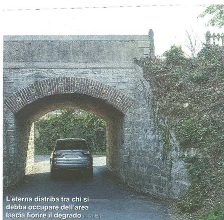
L'eterna diatriba tra chi si debba occupare dell'area lascia fiorire il degrado

Via Morelli Peggiora la situazione del ponticillo