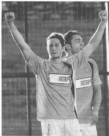
Crea esulta per la rete che manda al riposo il Legnano sul 2-0

pubblicato il 20/11/2017 a pag. IV sport; autore: Alessandro Chiatto