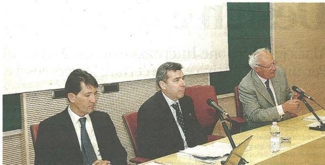
Ieri alla Liuc il tradizionale workshop annuale del settore gomma plastica e il rapporto Ambrosetti

«Ma stiamo ragionando sull'introduzione di corsi facoltativi dedicati al settore della plastica nel corso di laurea magistrale in ingegneria gestionale, dopo averli sperimentati con successo in passato nella triennale, dove erano seguiti da circa il 20% o 30% degli iscritti; senza dimenticare gli stage nelle aziende del settore presenti sul territorio». ■