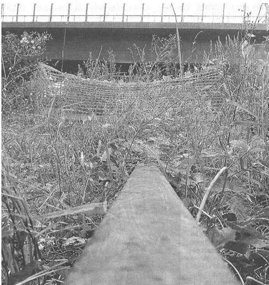
Il tracciato della ferrovia della Valmorea e, sullo sfondo, Pedemontana

Di fatto gli Amici della Valmorea sono le sentinelle del tracciato che partiva da Castellanza e arriva in Svizzera, anche se l'unico tratto ora percorribile a bordo del treno turistico parte da Castiglione Olona . Quando furono segate le rotaie Baroni solle-