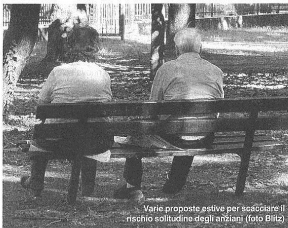
Varie proposte estive per scacciare il rischio solitudine degli anziani

L'assessore Sommaruga illustra le iniziative allestite: «Una priorità»