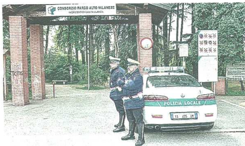
Le polizie locali di Busto Arsizio, Castellanza e Legnano uniscono le forze

L'altro giorno in giunta a Castellanza è stato approvato il protocollo operativo che consentirà l'impiego di due agenti del comando bustese per 4 ore per cinque giorni alla settimana per un periodo di sei mesi, un aiuto importante per gli agenti castellanensi mentre si attende di poter ampliare l'organico tramite