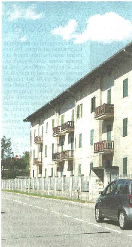
Le case popolari di via Brennero a Olgiate Olona

DISTRETTO Famiglie in difficoltà, cresce la richiesta