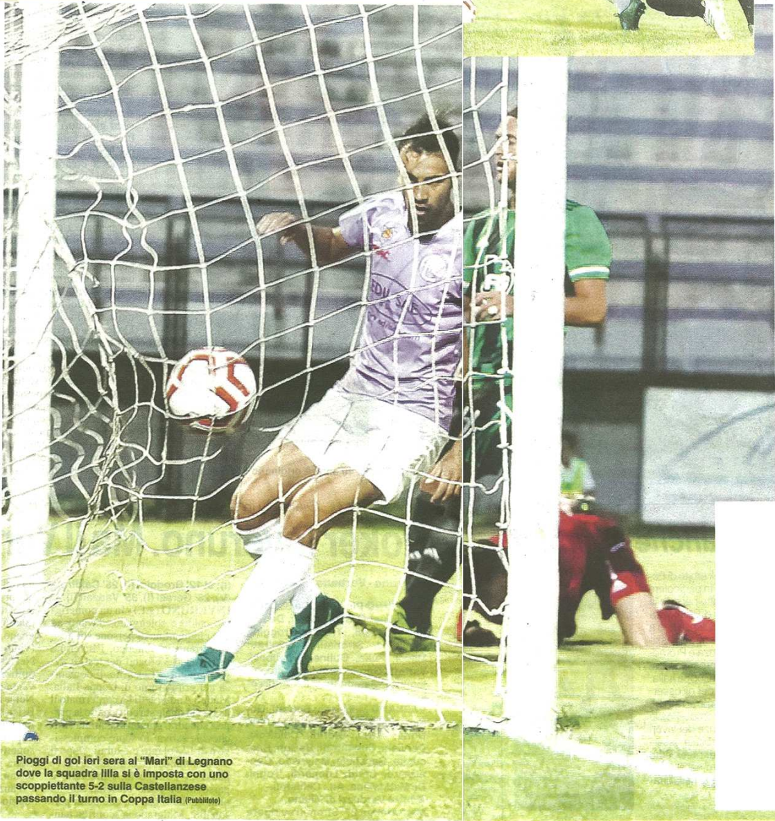
Pioggia di gol ieri sera al "Mari" di Legnano dove la squadra lilla si è imposta con uno scoppietante 5-2 sulla Castellanzese passando il turno in Coppa Italia

pubblicato il 19/08/2019 a pag. 24; autore: Emanuele Prina