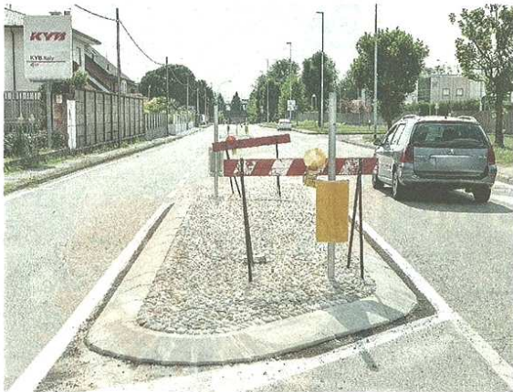
L'isola di via monsignor Colombo. Sotto, il dosso al Palaborsani

FONDI MINISTERIALI Utilizzati i centomila euro ottenuti