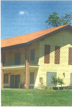
La sede va tenuta sotto controllo