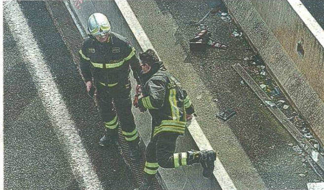
Pompieri in azione sulla Statale invasa dalla benzina uscita del serbatoio di una moto

Un bilancio pesante nel ponte di Pasqua per le strade varesine con quattro morti. Sabato pomeriggio a perdere la vita un motociclista 50enne che si è scontrato con un'auto guidata da