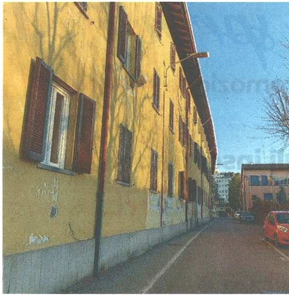
Le case comunali di via Cardinal Ferrari

Sono tre i progetti con cui Castellanza si candida ai fondi del Piano Nazionale per la ripresa e la resilienza: in primis c'è il rifacimento energetico delle case comunali in via Cardinal Ferrari (la palazzina a ridosso della casa di riposo Giulio Moroni). Si tratta di un complesso residenziale che attende da tempo lavori di riqualificazione: il progetto è stato giudicato ammissibile e adesso si attende di gareggiare nell'ambito del bando riservato a questo settore. C'è poi la riqualificazione di Villa Pomini: si propone di ristrutturare l'immobile ma anche di tutelare le collezioni d'arte al suo interno, al fine di una migliore valorizzazione. Infine si tenterà di intercettare risorse per la scuola media Da Vinci, che ha ugualmente bisogno di opere per l'efficientamento energetico: l'intenzione è di