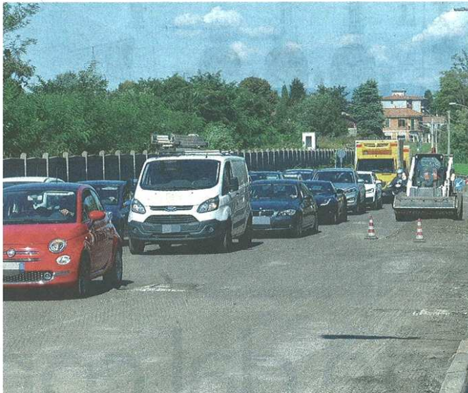
Con le multe il Comune di Castellanza finanzia lavori per la sicurezza stradale

Le cifre, che si basano sui bilanci precedenti della polizia locale, sono quelle contenute nella parte in entrata dello schema di bilancio di previsione pluriennale. E' previsto uno stanziamento iniziale su cui calcolare il 50% delle somme vincolate per la sicurezza stradale: 1.082.976 euro per l'anno 2022, 1.086.976 euro per il 2023 e 1.082.976 euro per il 2024, alla voce "gettito presunto per sanzioni amministrative per violazioni alle norme del Codice della Strada". Ebbene, per l'anno 2022 saranno destinati 541.488 euro, per il 2023 543mila 488 euro, per il 2024 543mila 488 euro.