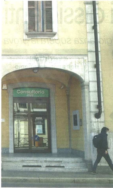
Il consultorio di Aisel ha sede nei locali di corso Matteotti di proprietà del Comune di Castellanza

CASTELLANZA Ragazzi e adulti provati: boom di richieste di aiuto psicologico