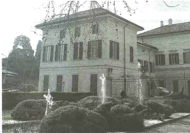
Il municipio di Castellanza, sede dell'attività amministrativa

pubblicato il 05/04/2020 a pag. 28; autore: Stefano Di Maria