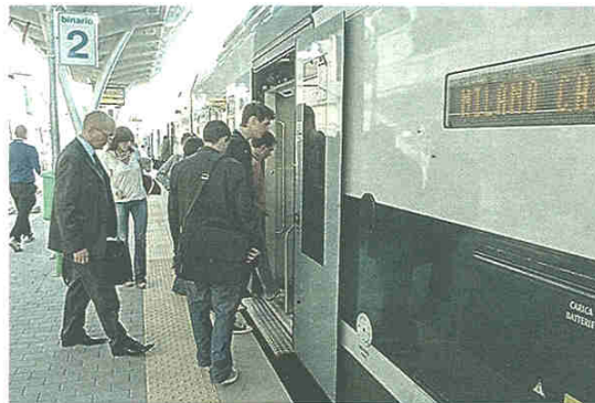
La stazione di Castellanza: il sottopasso mai aperto è nelle vicinanze

Nel mese di dicembre dello scorso anno il Consiglio superiore dei Lavori pubblici ha confermato il progetto di potenziamento della Rho-Gallarate e in-