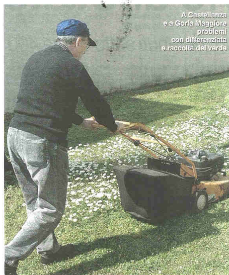
A Castellanza e a Gorla Maggiore problemi con differenziata e raccolta del verde

A partire dal prossimo 15 aprile le forniture di sacchi arriveranno a casa