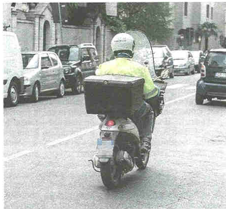
La riduzione dei servizi sta generando parecchi guai

Il riferimento è all'emergenza coronavirus, che ha portato i vertici di Posteitaliane a lasciare aperto a Castellanza solo l'ufficio centrale di via Roma, tre giorni a settimana. Il dubbio, per chi aspetta documenti importanti o bollette da pagare alla scadenza, è se debba andare alla sede principale per reclamare la suacorrispondenza: certo è un problema «perché se paghiamo luce o gas in ritardo, ci tocca poi