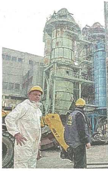
L'inceneritore ex Accam

I vertivi di Neutalia hanno incontrato comitati e ambientalisti Presentate le opere fatte e il programma