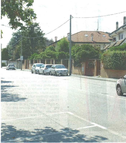
Via Morelli è circondata da villette, non ha dispositivi per controllare la velocità, né una ciclabile laterale sicura per pedoni e ciclisti

Mentre la gente continua a guardare sconcertata le auto che sfrecciano, il caso diventa politico. L'esponente del Centrodestra Unito Giovanni Manelli (Fratelli d'Italia) ricorda di avere segnalato più volte il