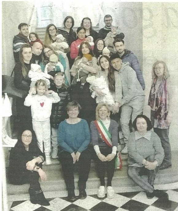
L'ultimo appuntamento dedicati ai nuovi nati

L'EVENTO È DIVENTATO UNA PIACEVOLE CONSUETUDINE PER L'INTERA CASTELLANZA IL BENVENUTO AI NUOVI NATI