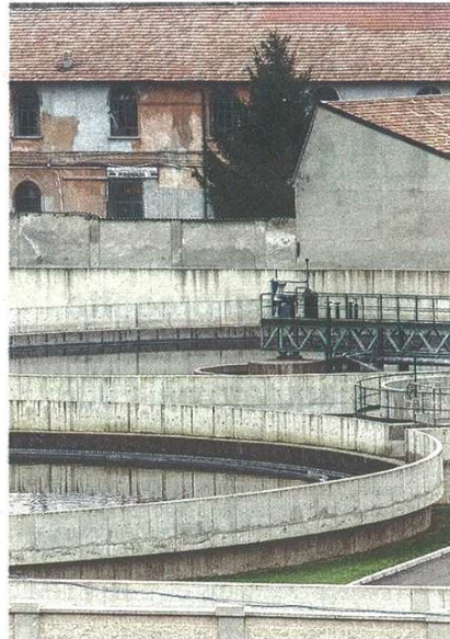
Un'immagine del depuratore di Olgiate Olona. Sotto, il grafico realizzato da Alfa per riassumere le segnalazioni relative all'origine delle puzze che si avvertono in valle

Confermato che all'origine dei miasmi non è l'attività del depuratore di Olgiate