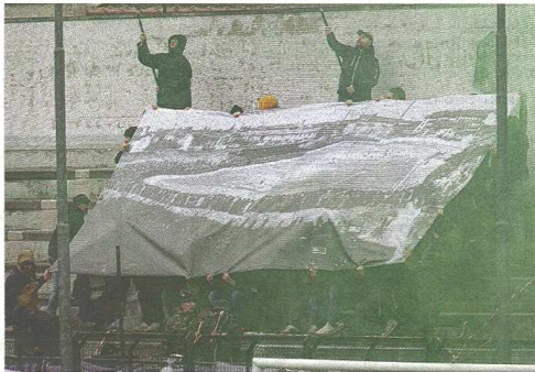
Il bello striscione esposto dagli ultras del Legnano per celebrare il ritorno al "Mari" dopo la trasferta a Caronno Pertusella per la risistemazione post-Palio