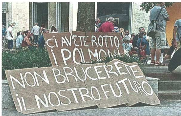
Protesta in piazza San Magno a Legnano contro la riaccensione dell'inceneritore

A spiegare come siano stati indirizzati i primi investimenti - 12 milioni di euro - ha invece pensato l'amministratore delegato, Stefano Migliorini: «I tre driver per gli investimenti? Attenzione a ridurre emissioni e impatti su aspetti ambientali, perseguire efficienze e ripristinare affidabilità e continuità di esercizio dell'impianto. Cinque milioni sono già stati spesi, altri due sono in programma e gli altri seguiranno». Per cosa? Adeguamento del sistema di trattamento delle acque reflue e il reimpiego nei processi interni della risorsa idrica, il potenziamento del sistema di abbattimento degli ossidi di azoto, l'installazione di sistemi di controllo del mercurio in continuo. Si è lavorato poi sul cuore dell'impianto, il gruppo che va dalla caldaia alla turbina. Spesi quattro milioni di euro per la caldaia della linea uno, nei prossimi mesi torneranno in servizio i turbogeneratori della linea uno e due, danneggiati dall'incendio del gennaio 2020. La linea due sarà in esercizio già nei prossimi mesi, la linea uno nella seconda parte dell'anno.